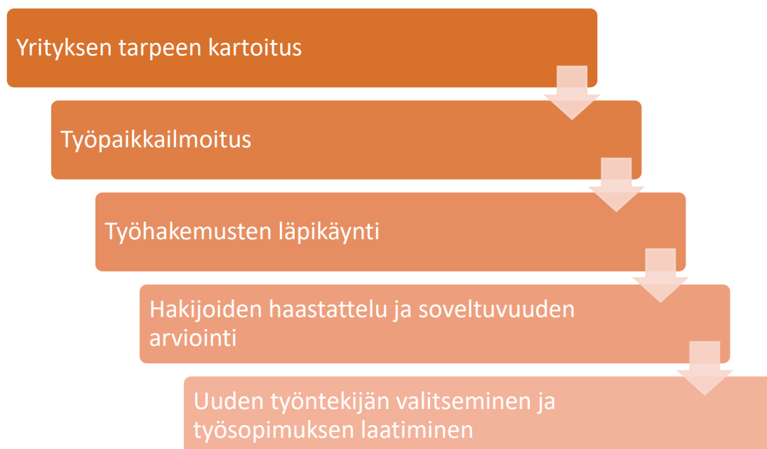
Kuvio 2. Rekrytoijan rekrytointiprosessi. (Mikael Kiviluoto 2022).

yrityksessä. Työtehtävään pystyy perehdyttämään etänä erilaisien videopuhelusovellusten avulla, esimerkiksi Skype tai Microsoft Teams. (Kaufman ym., 2020.)