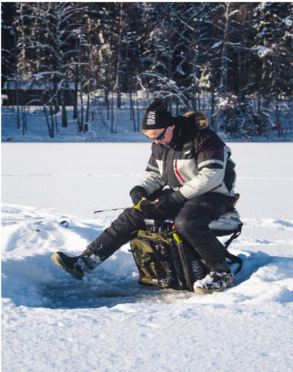
Kuva 3. Luotainpilkintää Linnansaaren kansallispuistossa. (Kuva: Niko Venäläinen).