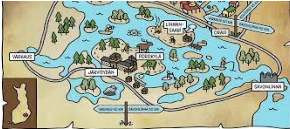
Kuva 1. Pääalue kehitettäville pilkkiretkille.