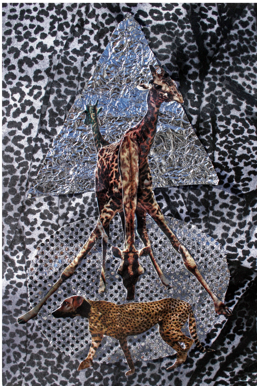
“PYHÄ KOLMIYHTEINEN JA KANSA KOIRAN VEROINEN” KOLLAASI 2014

Tätä kuvaa käytin osana lopputyötäni. Tajusin vasta jonkin aikaa tämän valmistuttua, että tämä kiteyttää juurikin fiiliksiäni Martikaisen Usko -albumista jota olin lopputyöprosessini aikana kuunnellut. Itseasiassa löysin myös yhtymäkohtia Martikaisen taiteeseen. Kaikki tapahtuu alitajuisesti.