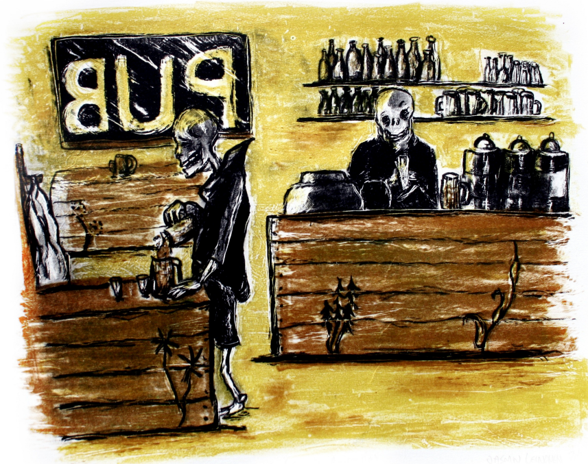
"KUOLEMAN PUUTARHA" LITOGRAFIA 2011

Rakenna suoja ylleni oi armahin hautaani sataa.