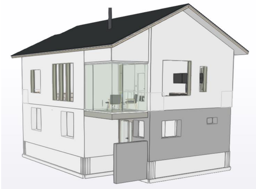
Kuva 1. Referenssikohteenä olevan rakennuksen 3D malli.

Referenssikohteenä toimii kaksikerroksinen omakotitalo, joka sisältää 5h+k+s+ph+khh+2wc+tek.tila+var. Yhteensä talon asuinpinta-ala on 138 m 2 . Kiinteistössä lämmitysmuodoksi valikoitui maalämpö. Ilmanvaihto toteutetaan tulo- ja poistoilma koneella, joka sisältää lämmöntalteenoton ja tuloilman esilämmitysvastukset. Sähköajoneuvojen lataus mahdollisuus toteutetaan sijoittamalla yksi 11 kilowattinen Type-2 latauspaikka talon ulkoseinään. Latauspaikkaan tullaan sisällyttämään dynaaminen tehonhallinta, joka säätää lataustehoa 10–100 % välillä muun kiinteistön kulutuksen mukaan. Ajoneuvojen lämmitys toteutetaan ulkoseinissä olevista pistorasioista. Talo varustellaan kalusteiden ja ratkaisujen osalta melko tavanomaisesti, mutta erityistä huomiota asetetaan asuinhuoneiden muunneltavuuteen sähköpisteiden määrien osalta. Sähkönjakelujärjestelmä kiinteistössä tullaan toteuttamaan siten, että liittymiskaapeli tulee kiinteistön alemman kerroksen tekniseen tilaan, johon sähköpääkeskus sijoitetaan. Pääkeskuksesta lähtee nousukaapeli ylempään kerrokseen sijoitettavaan ryhmäkeskukseen.