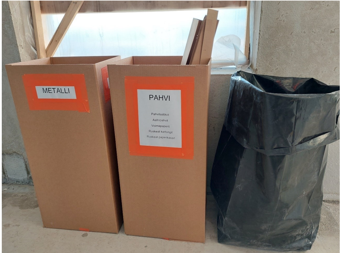
Kuva 4. Lajittelun mahdollistavat jätteastiat.

kuvan 4 mukaisesti mitä niihin saa laittaa. Kerroksissa kerättävät jätelajit vaihtelevat rakennusvaiheen mukaan, eivätkä sisällä asentajaryhmä kohtaisia jätteastioita.