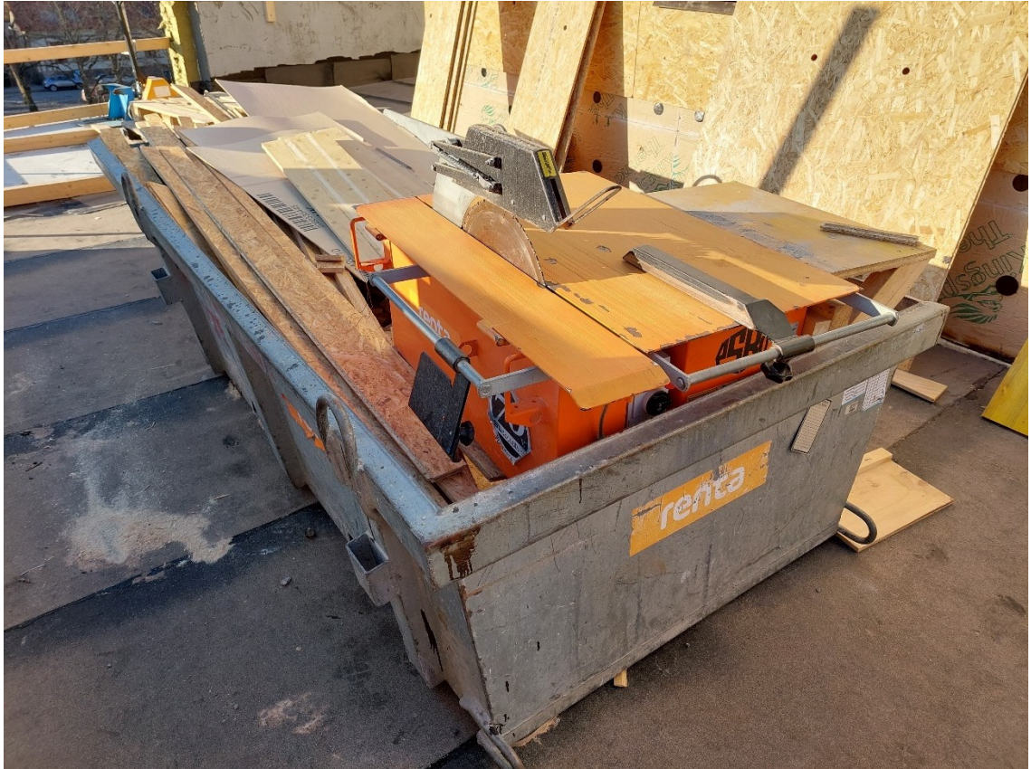
Kuva 5. Pöytäsiirkeli jassikassa.

mahdollista. Paloturvallisuuden näkökulmasta on huomioitava sahan mahdollinen kuumeneminen, sijainti ja alkusammutuskalusto. Asentajat keräsivät kierrätyskelpoisen puun hukkapalat pienempään, pyörillä kulkevaan nostokoriin.