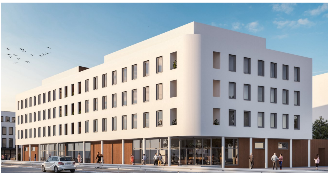
Kuva 2. Taiteilijan visualisointi siitä, miltä Turun Gloria tulee näyttämään. (Lehto asunnot myyntiaineisto 2022)

Opinnäytetyön kohdetyömaa on Lehto Asuntojen rakentama asunto-osakeyhtiö Turun Gloria. Neljä kerroksisessa ullakollisessa asuinkerrostalossa on 70 asuntoa ja liiketila. Rakennuksessa on myös taloyhtiön saunatila, portaat rappukäytävän kummassakin päässä, varastotiloja ja Smartpost-automaatin huone. Turun Gloria on teräsbetonirakenteinen kerrostalo, jossa on paikallavaluholvit, elementtiseinät ja rapattu julkisivu. Rakennuksen viereen rakennetaan samanaikaisesti Lehdon toimesta seuraavaa rakennusta nimeltä Turun Olva, jonka vuoksi työmaalla syntyy runsaasti eri rakennusvaiheille ominaisia jätelajeja. Kuvassa 2 on esitetty Turun Gloria.