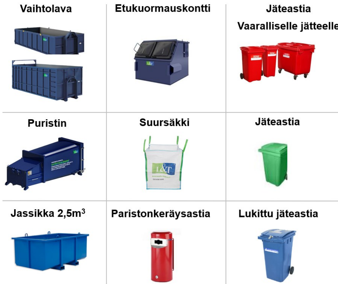
Kuva 3. Jätehuollon keräysvälineet ja laitteet (L&T 2022)

Puunjätteen lajitteluun pyrittiin hyödyntämällä kahta jätteenkeräysvälinettä, josta toinen oli 15 m 3 vaihtolava kierrätyspuulle ja toinen 2,5 m 3 nostokori eli jassikka sekalaiselle puulle. Puujätteen lajittelu näiden kahden jakeen välillä ei onnistunut, sillä jassikka oli liian pieni keräysväline sekalaiselle puulle. Tämän seurauksena sekalaista puujätettä päätyi kierrätyspuun vaihtolavalle, jonka vuoksi koko jäteerä määritettiin sekalaiseksi puuksi.