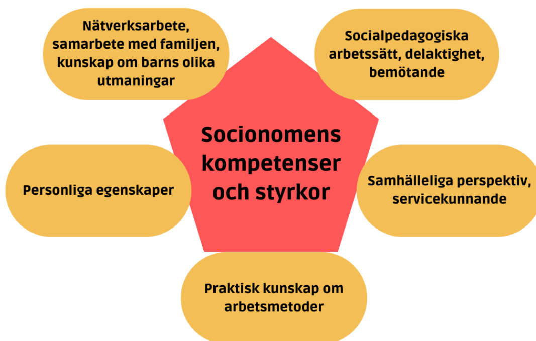
Figur 3. Socionomens kompetenser och styrkor

Till sist tas upp två olika svar som inte kunde sättas i skilda teman . I ett svar kom det fram lugn, tålmod och vänlighet, som kan tolkas som mer personliga egenskaper, men inte har en rak koppling till specifikt socionomens kompetenser. En annan respondent svarade att socionomen har kunskap om barns olika utmaningar.