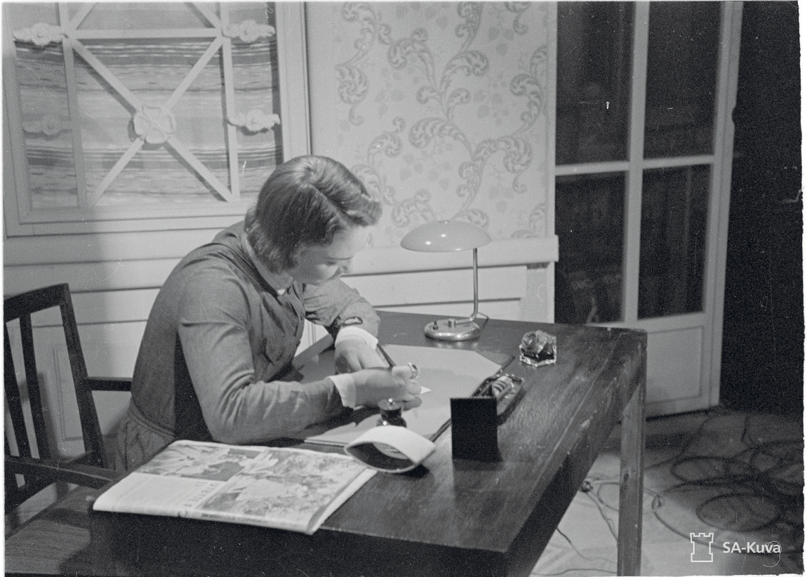
Kuva 3. Lotta kirjoituspöydän ääressä.

avaa yksityishenkilöille mahdollisuuden saattaa omat sotaa koskevat aineistonsa osaksi Muistin yleisökoelmaa ja rikastamaan suomalaista sotahistoriaa (kuva 3).