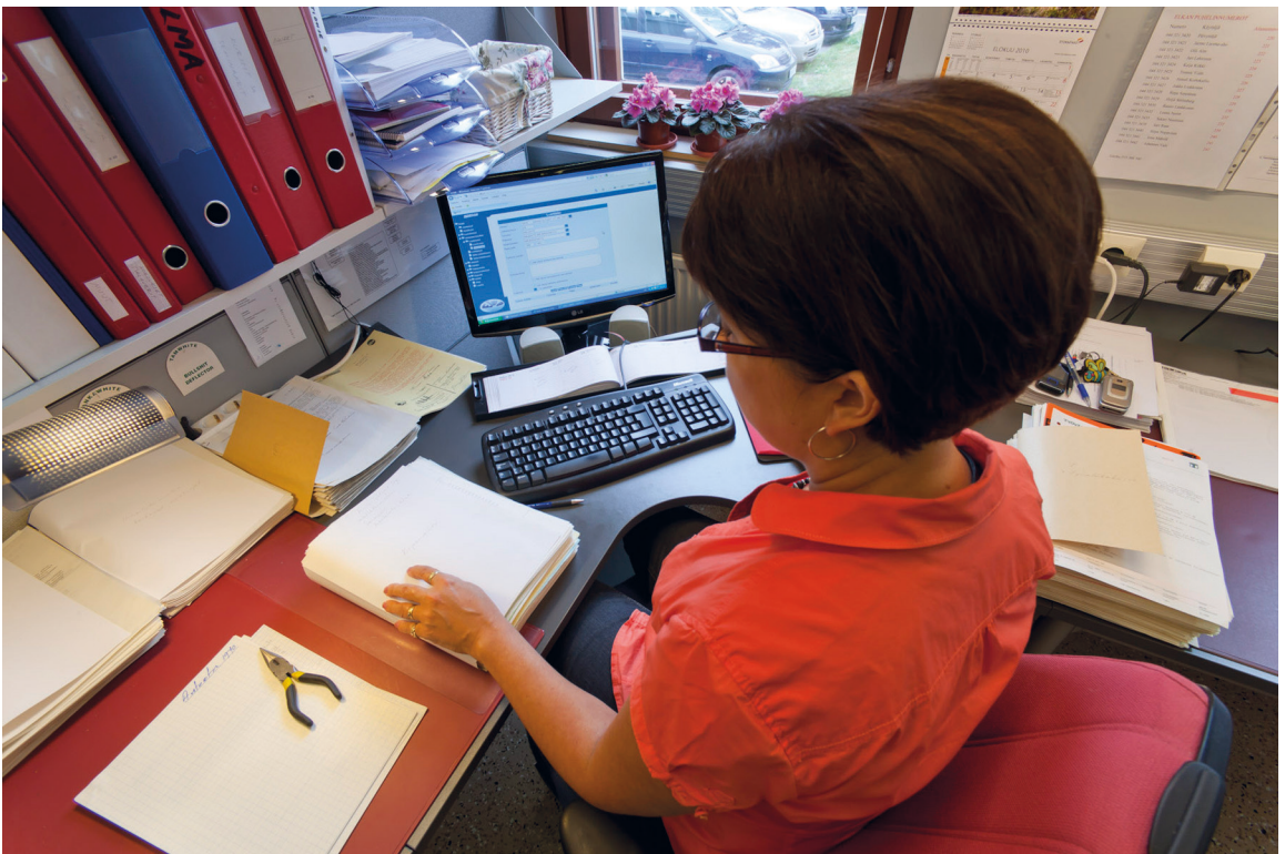
Kuva 4. Elkan sähköinen arkistointi.

Lue lisää Memoriaalista: https://www.xamk.fi/memoriaali