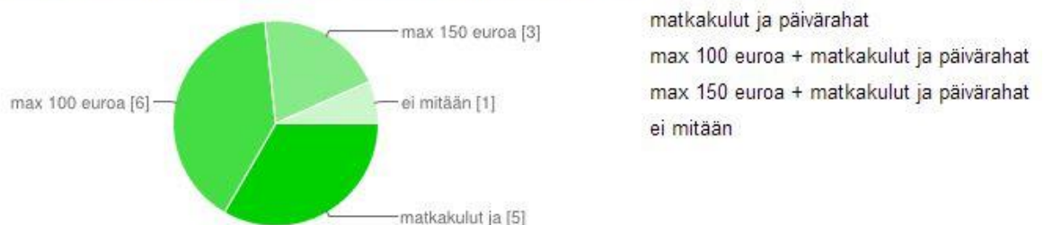
Kuvio 2 Maksuhalukkuus ja -valmius

Seuraavaksi kysyimme millaisia sanataidepajoja kirjastot haluaisivat. Näitä sisältötoivomuksia tiedustelimme omien pajojemme suunnittelua varten. Kirjastot toivoivat mm. monipuolisia, erilaisiin teemoihin liittyviä kokonaisuuksia, luovan- ja suullisen ilmaisun harjoittamiseen liittyviä tehtäviä sekä poikkitaiteellisia toimintamuoto-