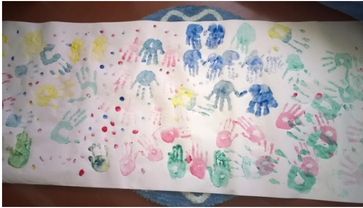
Kuva 7: Lasten ja aikuisten maalaama pullopostiviesti

lapsi ja aikuinen sai maalattua paperille omat kätensä hätäviestiksi, kuten alla olevasta kuvasta näkyy. Maalaamisen jälkeen lapset kävivät pesemässä värjätyt kätensä ”rannassa järvi-vedellä” eli lasten askartelemassa järvihuoneessa, jossa oli iso pesuvati ja pyyhkeitä. Osa lapsista halusi käsien pesun jälkeen maalata vielä uudestaan paperille ja päästä järvihuoneeseen ja tämä toki mahdollistettiin.