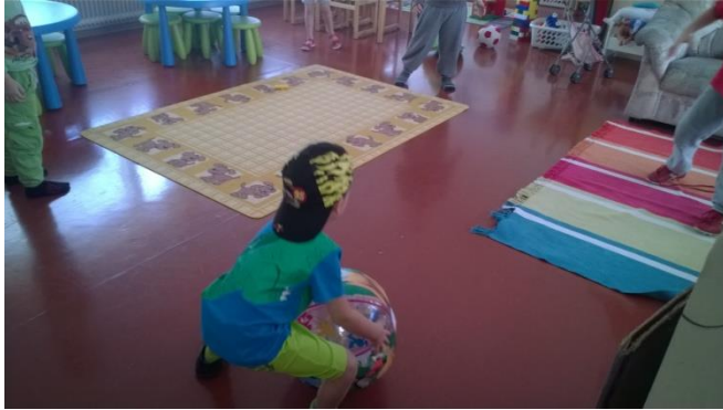
Kuva 8: Lapset jatkavat kesäteemaa vapaaleikissään

Yhteisleikki kesti noin tunnin verran kuten edellisinkin leikkiaamuina. Uloslähdön siirtymässä jatkoin leikkiteemaa vetämällä lapsia vähitellen viltillä kohti eteistä, koska muutama lapsi oli leikin alussa pyytänyt vilttiajelua ”Uudestaan!” Samalla pystyin kyselemään lapsilta tuoretta palautetta leikistä. Jälleen lapset odottivat innoissaan vuoroaan päästä kyytiin. Omaa pukeutumivuoroaan odottavat lapset jatkoivat keskenään kesäteemaa heti yhteisleikin päätyttyä pelaamalla yhdessä erään pojan kotoa tuomaa rantapalloa.