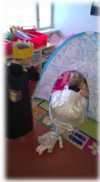
Kuva 4: Lapset suunnittelevat igluun asettumista niin että kaikki mahtuvat

Viimeiseksi lapset menivät varjosuojaan uudestaan ja pulloposti löydettiin, josta luettiin viimeinen viesti "Olette jo erittäin lähellä sormuksia. Missähän ne mahtavat olla? -Onneksi olkoon urheille ritareille ja prinsessoille sormusten löytymisestä, kyllä nyt on kuningatar mielissään!" Annoin vihjeen sormusten olinpaikasta ja lasten etsiessä yksi tyttö löysi mukin sormuksineen lasten sängystä ja näytti olevan kovin mielissään. Hän halusi itse ottaa sormukset mukista ja antaa ne kuningattarelle. Tämä aikuinen dramatisoi sormuksien löytymistä innoissaan. Lapset saivat kaikilta kehuja hienosta seikkailusta ja arvokkaiden sormusten löytymisestä sekä yhteisestä retkestä.