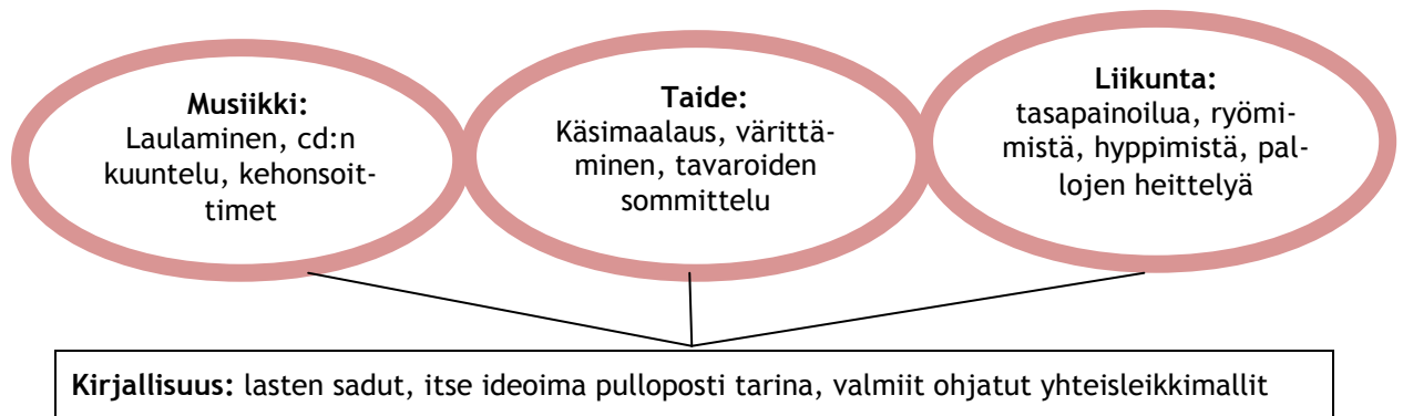
Kuvio 2: Opinnäytetyössä kirjallisuuteen soveltaen yhdistetyt taideaineet

Luvussa 3 käsittelin teoreettisesta ja tutkimuksellisesta näkökulmasta käsin yhteistyötaitojen ja yhdessä tekemisen tärkeyttä yhteisöllisyyden ja sosiaalisten vuorovaikutustaitojen vahvistamisessa. Tähän teoreettiseen viitekehykseen nojautuen, keskityin toiminnan suunnittelussa siihen, että leikit olivat aikuisten ja lasten yhdessä toimimista mahdollisimman monipuolisten taideaineiden ja toimintojen äärellä. Tällä pyrin mukailemaan ja tukemaan leikkipedagogiikan tapaan lasten luontaisia leikkitaipumuksia erilaisten toimintojen yhdistämisestä. Yhdistelin satuleikkeihin musiikkia, taidetta ja liikettä. Alla olevaan kuvioon kokosin opinnäytetyössä sovellettuja toimintoja. Leikkejä kehittävä osuus muodostui turvallisesta aikuisten mukanaolosta ja erilaisten toimintamallien ja esimerkkien antamisesta. Leikkipedagogiikka on erinomainen tapa rakentaa toimintaa yhdessä lasten kanssa alusta alkaen.