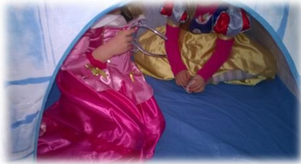
Kuva 1: Prinsessoja iglussa teemaleikkiin pukeutuneena

Ensimmäinen toiminnallinen päivä järjestettiin keskiviikkona 5.3.14. Teemana oli Nuppulan lasten valitsema prinsessa-ritari-päivä. Lapset olivat toivoneet seikkailurataa ja majaleikkejä, niinpä päätin yhdistää nämä toiveleikit lasten valitsemaan teemaan. Tarkoituksena oli rakentaa yhdessä lasten ja aikuisten kanssa seikkailurata päiväkodin sisätiloihin. Seikkailun motiivi oli yhteinen ja lapset aikuisiin liittävä: etsiä ”kuningattarelta” eli päiväkodin toiselta aikuiselta sormistaan kadonneet sormukset ja palauttaa ne takaisin. Seikkailurataa en halunnut suunnitella etukäteen liian tarkasti, jotta tarinan eläminen ei olisi liian sidottua. Suunnittelussa olin kiinnittänyt huomiota tarinan luomiseen erilaisten tehtävien muodossa, mutta seikkailuradan rakentamisessa keskeistä oli yhdessä tekeminen ja sitä kautta leikkiin innostaminen ja siihen sitouttaminen. Seikkailurataleikissä sovellettiin leikkipedagogiikkaa niin, että yhteisessä leikissä yhdistyivät tarinallisuus tehtävien muodossa, liikkuminen, ongelmien ratkaiseminen, musiikki laulamisen ja äänien tuottamisen muodossa sekä draama aikuisten eläytyessä rooleihinsa. Leikin juonen piti koossa prinsessa ja ritari teema.