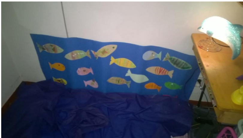
Kuva 6: Lasten ja aikuisten tekemä järvihuone

Ryhmäpäiväkodin lapset ja aikuiset olivat aikaisemmin viikolla kesäteemaan liittyen keskenään muodostaneet pienestä varasto/leikkihuoneesta suloisen ”järven”. Lattialle oli laitettu sadeviitta esittämään järvivettä, aivan kuin eräs lapsi oli haastatteluissa ehdottanut ja lisäksi samaa viittaa oli käytetty prinsessa-ritaripäivänä järvenä. Seinän aikuiset olivat vuoranneet sinisellä kartongilla, johon lapset olivat askarrelleet ja kiinnittäneet kaloja uimaan. Järvihuone kertoi koko ryhmän motivaatiosta teemaviikkoa ja yhteisleikkipäivää kohtaan. Yhdessä mietimme miten huonetta voisi soveltaa leikkipäivänä.