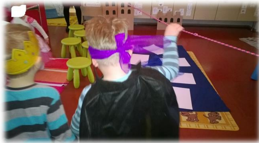
Kuva 3: Lapsi auttamassa sokkona kulkevaa kaveria selviämään metsän haasteista. Taustalla myös seikkailun ”järvi kivineen”.

ja suurin osa auttajan roolissa. Alla olevassa kuvassa näkyy sokkorata tuoleineen aikuisten pitäessä nuorasta kiinni. Kyselin lapsilta, kuka haluaa auttaa sokkona kulkevaa selvittämään radan, jossa esteinä oli kiviä eli tuoleja. Jokainen lapsi halusi olla auttajana ja heille tulikin kilpailua siitä kuka saisi auttaa. Kannustin lapsia itse neuvottelemaan ja autoin valinnassa. Kehotin sokon auttajaa, joka piti autettavaa kädestä kiinni kertomaan sokolle esteistä ja auttamaan myös suullisesti. Lapset kuitenkin keskittyivät enemmän kädestä kiinni pitämiseen ja näin auttoivat toinen toisiaan selviämään esteistä. Toinen aikuinen huomasi yhden lapsen antavan sanallisestikin neuvoja. Sokkona kulkemisessa sokean on luotettava kaveriinsa ja kaverin tehtävänä on ymmärtää sokkoa ja asettua häneen asemaansa. Huomasin, että leikin avulla voidaan opettaa ja kannustaa lapsia paitsi neuvottelemaan, myös suullisesti auttamaan ja tukemaan ystäviä. Tällaisen työskentelytavan omaksuminen vaatii kuitenkin pitkäjänteistä totuttelua niin aikuisilta kuin lapsiltakin.