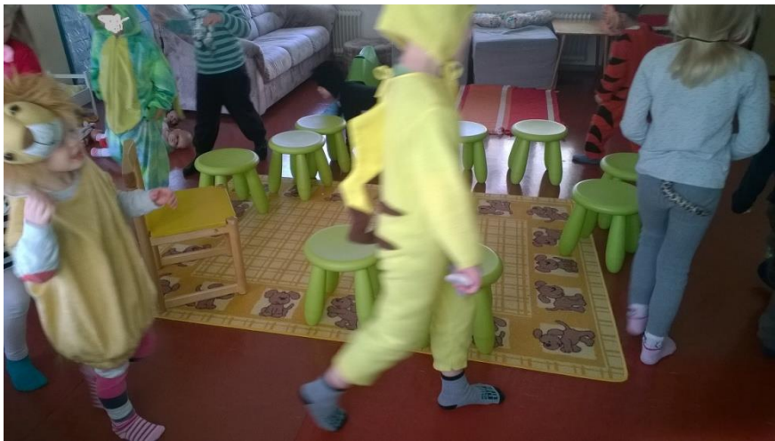
Kuva 5: Eläinlapset kulkevat musiikin tahtiin leikissä, jossa tuolit vähenevät

tärkeänä jokaisen lapsen oman yksityisyyden suojaamista ja siksi leikin sääntönä oli syliin menemisen lisäksi pelkkä koskettaminen. Näin jokainen lapsi sai valita itselleen miellyttävimmän tavan toimia. Itse pidin lapsia olkapäästä kiinni. Kaikki lapset osallistuivat läheisyyden antamisleikkiin. Havaintojeni perusteella lapset näyttivät tuolileikistä kiinnostuneilta ja keskittyivät musiikin kuunteluun tarkkana. Iloinen musiikki ja liikkuminen saivat osan lapsista nauramaan ääneen. Leikistä olisi saanut vielä mielikuvitusriikkaamman lapsen näkökulmasta, jos siihen olisi liittänyt tarinan. Leikin idea kuitenkin keskittyi läheisyyden tunteen opetteluun ja kokemiseen, toisten huomioimiseen sekä musiikin kuunteluun ja lapset oivalsivat sen lopulta hienosti.