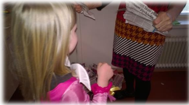
Kuva 2: Tyttö prinsessa-asussaan rikkomassa ”hämähäkinseitettä”

Hämähäkkimetsästä selviytyminen osoittautui lasten kannalta kaikkein mielenkiintoisimmaksi ja tunteita herättävimmäksi niin poikien kuin tyttöjenkin osalta. Me aikuiset pidimme sanomalehdistä kovaa kiinni ja lapset vuorotellen saivat hakata ja repiä ”seitit” rikki, kuten yläpuolella olevasta kuvasta näkyy. Näytin lapsille miten valtavasti seittejä oli ja kehuin miten hyvin he niitä rikkoivat. Leikin idea perustuu energian purkamiseen ja sallittuun lyömiseen, niin että vain paperiin osutaan. Sitä voidaan kutsua myös tunteiden purkamisleikiksi, sillä ainakin tässä mielikuvitusleikissä lapset näyttivät ikään kuin vihaisena sotivan seittejä vastaan. Ja onnistuttuaan siinä, lapset hymyilivät. Lapset ehdottivat, että saisivat miekoillaan rikkoa seittejä ja annoin luvan kokeilla, mutta sitten päädyimme nyrkkeihin, koska se oli turvallisempaa. Hämähäkin seittien rikkomisen osoittautui loistavaksi osaksi seikkailurataa, sillä etenkin pojilla on fyysinen tarve leikeissään ”sotimiseen”.