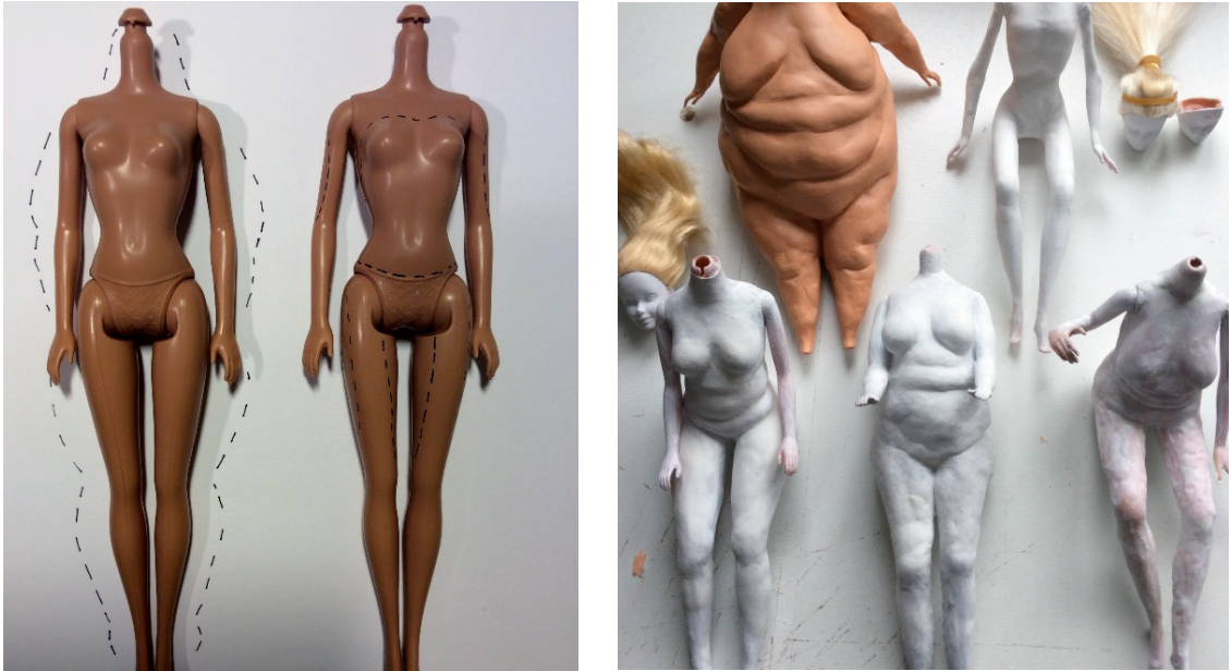
Kuvat 3. ja 4. Teosten muokkaamisen vaiheita

Osalla nukeista on jossain vaiheessa prosessia jäänyt pää pois. Teoksessani keho on minulle pääosassa, joten en ole kokenut kaikkien nukkejen tarvitsevan päätä. Joiltakin on myös hiukset pois, ja muutama omistaa minun lapsena leikkaamani kampauksen. Tähän teoskokonaisuuteen päätin valmistaa 15 kappaletta nukkeja. Tulevaisuudessa teos varmasti kasvaa ja saa osakseen lisää eri aiheita käsiteltäväksi.