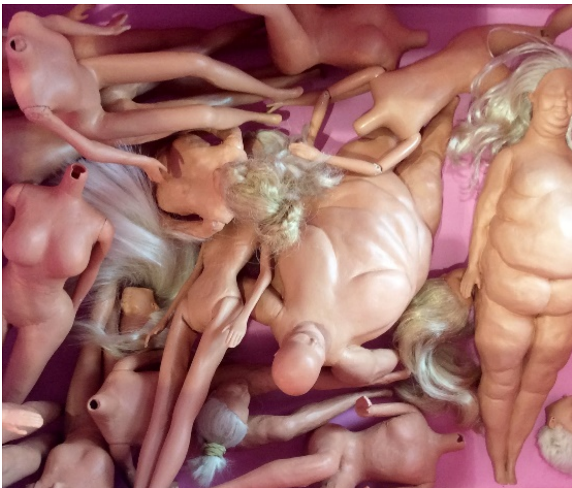
Kuva 5. Valmiita nukkeja vaaleanpunaisessa ympäristössä

Tekoihon värin käyttö on minulle suhteellisen uutta. Ennen suorastaan vihasin väriä. Jostain syystä aloin käyttämään kumminkin tuota minulle ahdistavaa väriä, ja nyt se on jäänyt minun teoksiini.