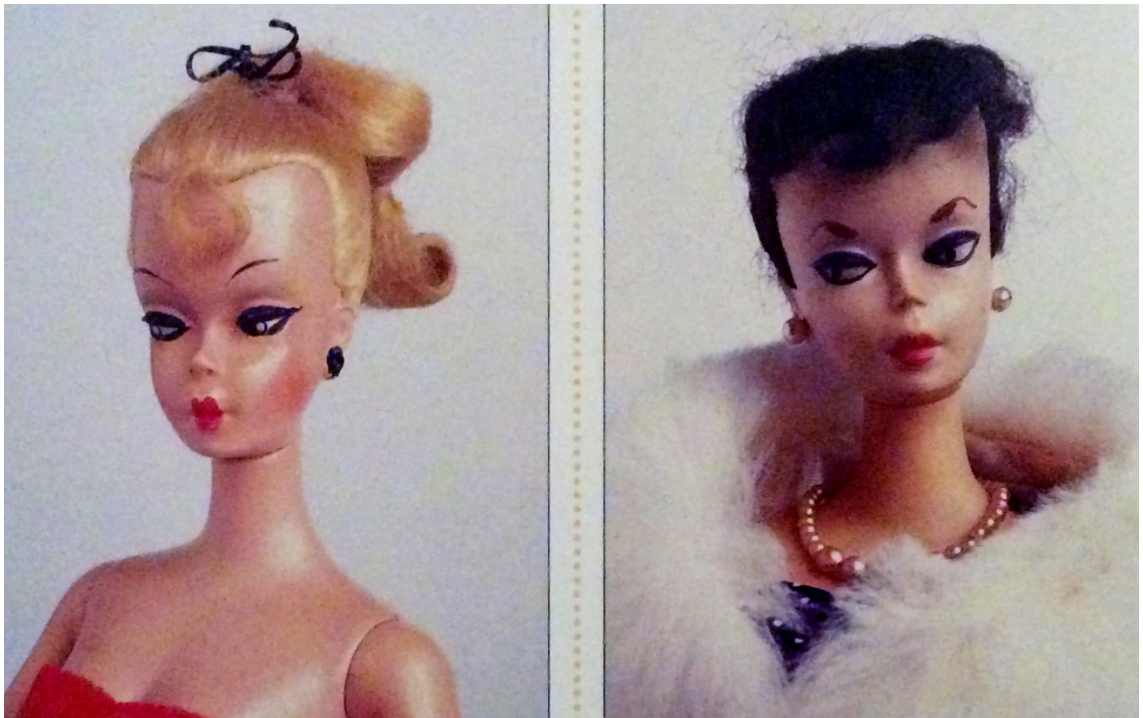
Kuva 1. Vasemmalla Bilt Lilli ja oikealla Barbie nro 1, Fennick 1998