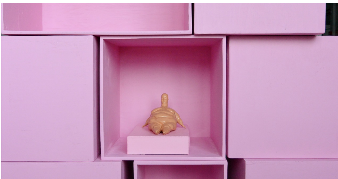
Kuva 6. Yksityiskohta installaatiosta, huoneesta numero 1, tapahtuma

Alusta alkaen Barbie-nuket on numeroitu, ja myös niiden asuja on numeroitu. Tästä sainkin idean numeroida myös omat nukkeni ja asunnot, joten näin ollen nuket ovat numeroltaan 1-15 ja huoneet 1-10. Kuvassa 6. on yksityiskohta installaation huoneesta numero 1 ja nukesta numero 1.