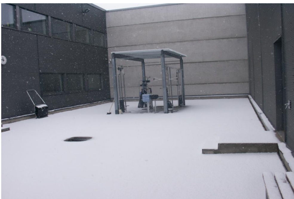
Kuva 4: Turun vankilan varmuusosaston ulkoilupiha