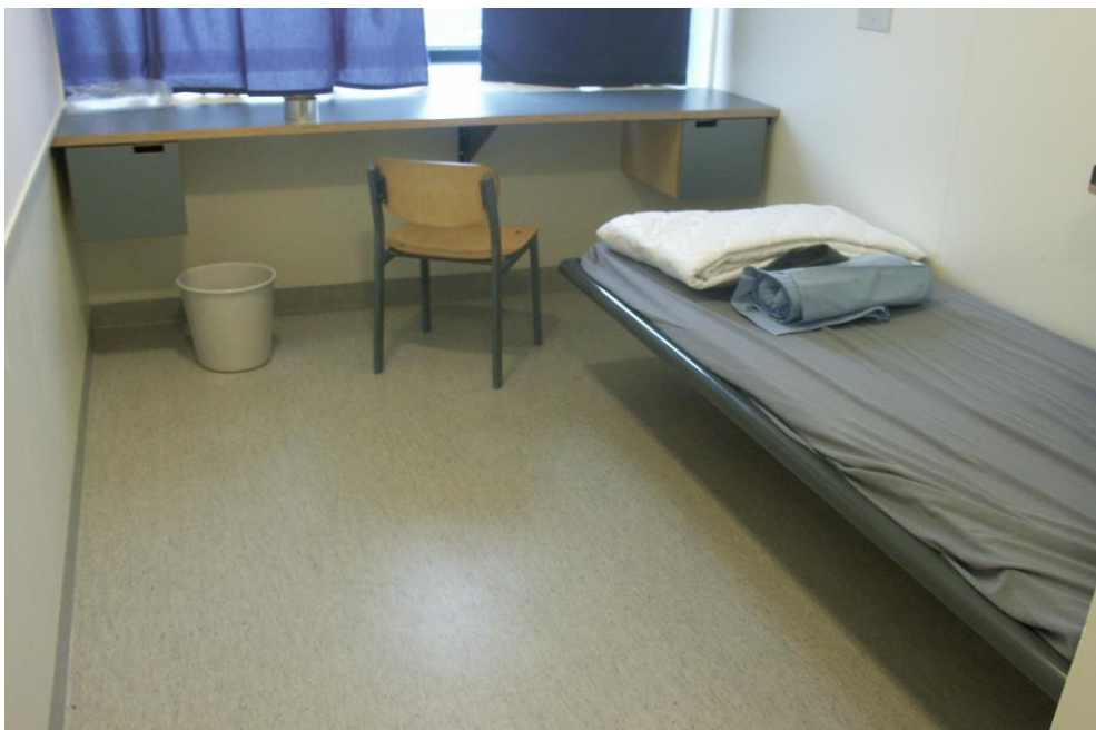
Kuva 3: Turun vankilan varmuusosaston selli