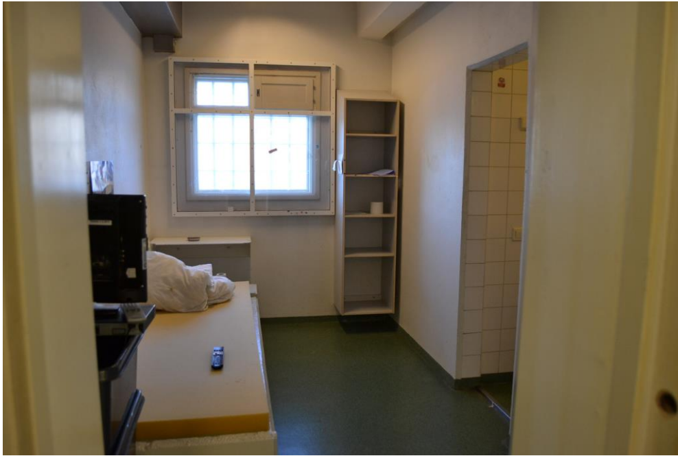
Kuva 1: Riihimäen vankilan varmuusosaston selli