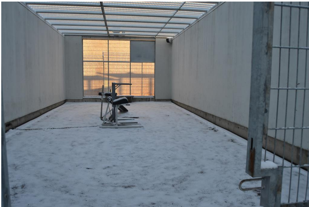
Kuva 2: Riihimäen vankilan varmuusosaston ulkoiluhäkki