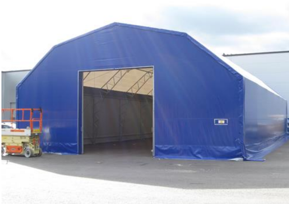
Figur 6. En PVC-hall.