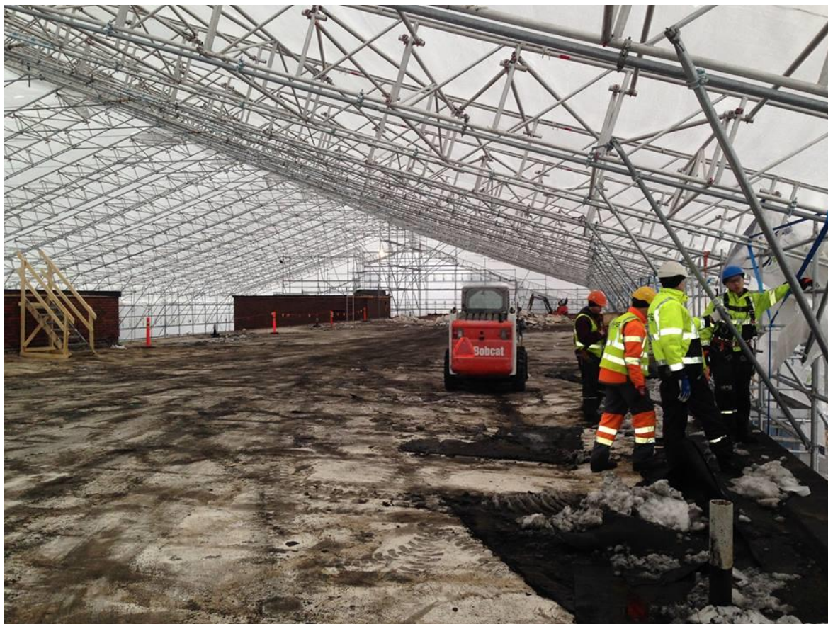
Figur 8. Under PROxA-väderskyddet. Under detta skydd ryms till exempel en fotbollsplan eller två ishockeyrinkar.

Mainingin koulun ala-aste i Esbo. Väderskyddet användes i 3 månader och det tog 3 veckor för 6 montörer att montera väderskyddet. Väderskyddet hade följande mått: spännvidd 44 m, längd 98 m, och en höjd på 8 m. Väderskyddet täckte in en area på totalt 4312 m 2 . 1