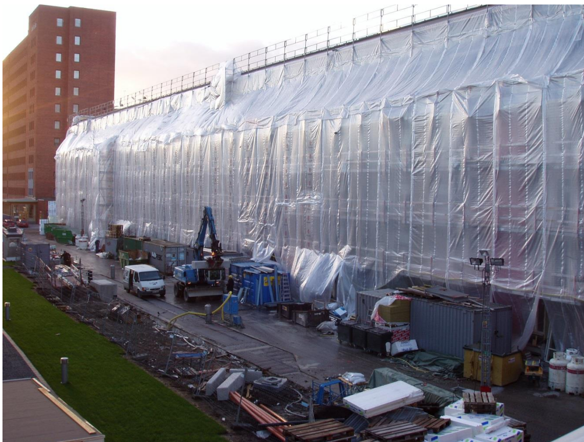
Figur 1. Fasadväderskydd på ställning.

Med fasadväderskydd menas att man fäster en duk eller skivor på ställningar som byggs upp utmed fasaden på en byggnad. 1 Materialtillförseln till bygget sker normalt med en bygghiss som placerats inuti eller utanför väderskyddet. 1