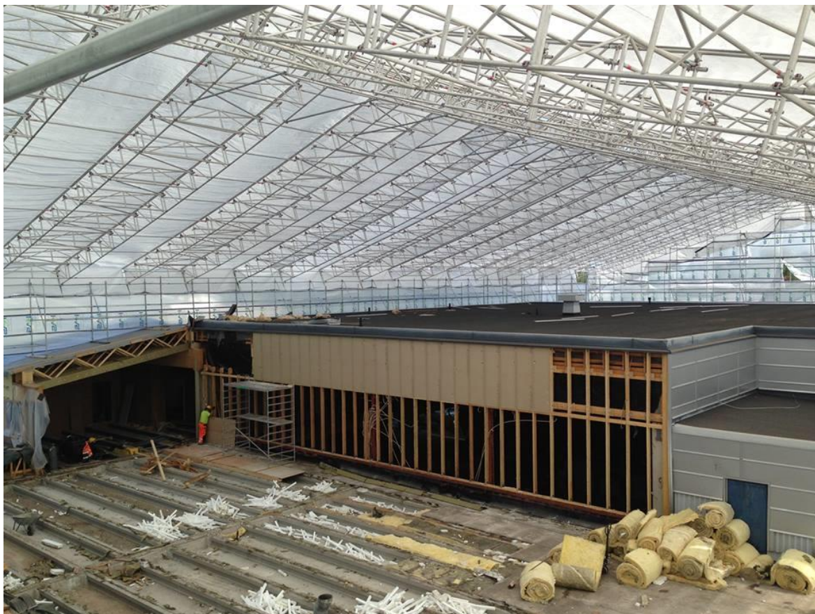
Figur 9. Under PROxA-väderskyddet. Detta väderskydd täcker en yta på 2275 m 2

Teuvan ylä-aste i Teuva. Väderskyddet användes i 4 månader och det tog 3 veckor för 6 montörer att montera väderskyddet. Väderskyddet hade följande mått: spännvidd 32 m, längd 71 m och en höjd på 12 m. Väderskyddet täckte in en area på totalt 2271 m 2 . 1