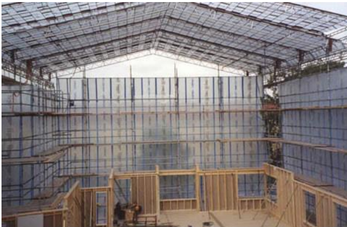
Figur 4. Inuti ett väderskydd med självstabiliserande stomme.