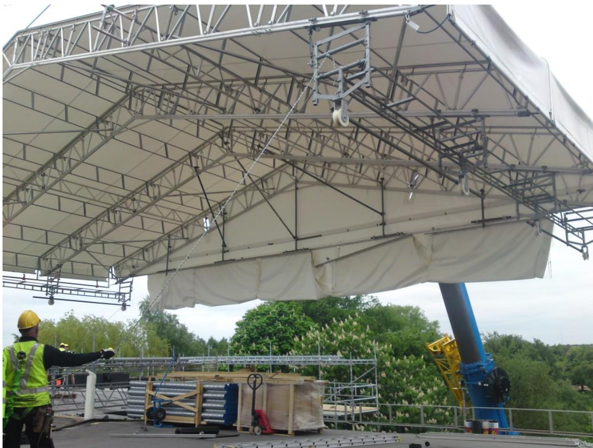
Figur 2. Ett mobilt takväderskydd som lyfts på plats.