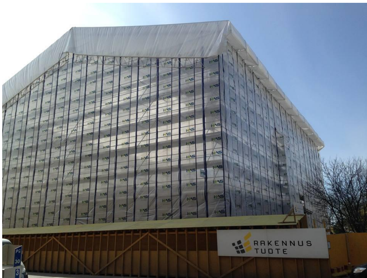
Figur 7. PROxA-väderskyddstak på PROxA-byggställningar.

HYKS Naistenklinikan grundrenovering i Helsingfors. Väderskyddet användes i 8 månader och det tog 4 veckor för 4 montörer att montera väderskyddet. Väderskyddet hade följande mått: spännvidd 36 m, längd 39 m och höjd 14 m. Väderskyddet täckte en area på totalt 1404 m 2 . 1