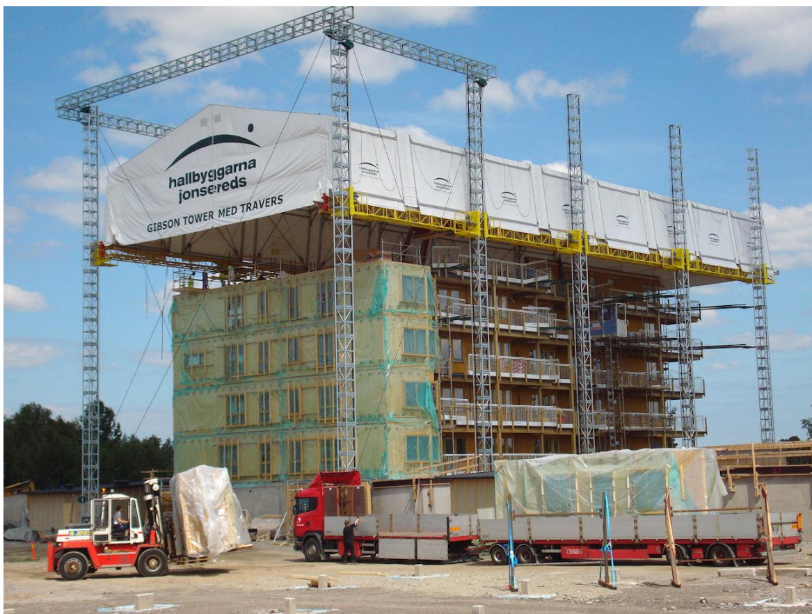
Figur 3. Ett klättrande väderskydd.