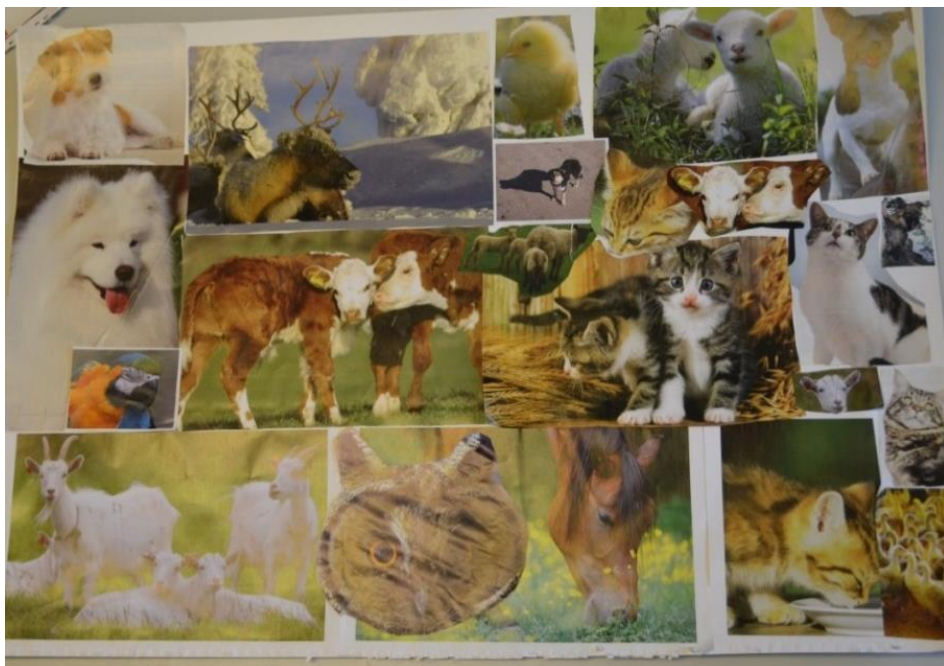
Kuva 9. Mielikuva valmiista työstä on ollut vahva jo tehtäessä

Työ kuvaa hyvin 4H-toiminnan mielikuvia. Ei ole olemassa yhtä selkeää linjaa ja toiminnassa voi olla mukana myös erilaisia aihepiirejä. Se mitä osa ryhmästä on toivonut, ei välttämättä olekaan kiinnostanut muita.