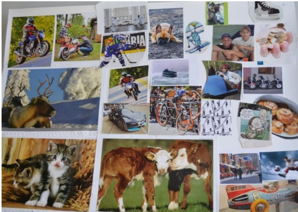
Kuva 7. Työstä nousi esiin monta teemaa

Toisaalta nämä toiveet voitaisiin, myös yhdistää yhdessä kerhossa tai tapahtumassa. Erityisen tärkeänä työssä esiintyvät luonto ja eläimet, jolloin voisi ajatella niiden olevan osa osallistujien arkipäivää tai arvomaailmaa. Tekijöiden piirustuksista voi päätellä heidän innokkuutensa ja toiveidensa tärkeyden, tätä on korostettu huutomerkein toiveiden huomioimiseksi.