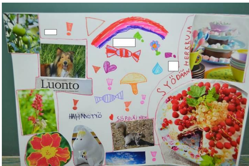
Kuva 6. Työstä on piilotettu tekijöiden nimet

Teoksien havainnoinnilla pyrittiin löytämään sellaista tietoa, mitä nuoret eivät yhteisesti olleet vielä jakaneet. Tarkoituksena ei ollut arvostella heidän töitään tai keskittyä visuaaliseen toteutukseen, vaan materiaalia käsiteltiin sisällön pohjalta. Näin saatiin luotua kuva ja käsitys siitä, miten nuoret näkivät 4H toiminnan mahdollisuudet.