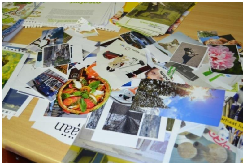
Kuva 2. Käytettävissä olevat kuvat edustivat eri teemoja

Tuloksena syntyi hyvinkin erilaisia ja erittäin mielenkiintoisia kollaaseja. Ryhmäkoon ollessa suuri, jaettiin ryhmät vielä hieman pienemmiksi 3–5 kerholaisen tiimeiksi. Näin jokainen osallistuja pääsi osallistumaan itse tekemiseen. Tällä voitiin myös turvata ideoiden saaminen ja tekijöiden motivoituneisuus työskentelyn aikana. Työskentelyyn annettiin aikaa, osa oli valmiina jo puolen tunnin päästä, viimeisetkin tunnin sisällä.