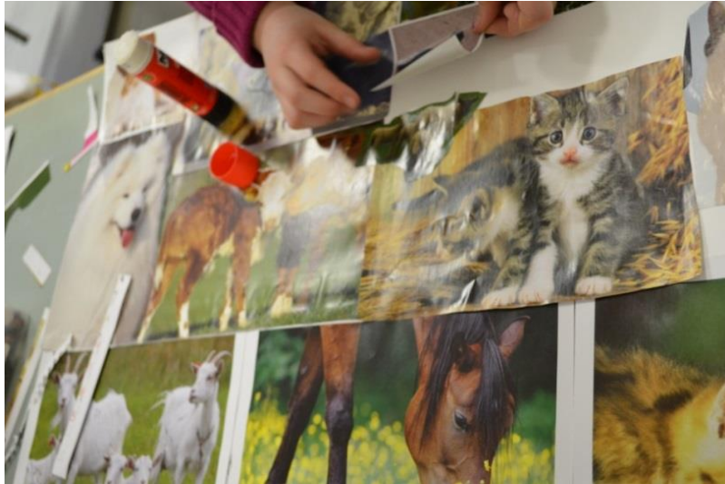
Kuva 4. Osa osallistujista tiesi tarkasti, millainen lopputulos olisi

Toiset osallistujista neuvottelivat ennen tekemisen aloittamista, millainen lopputulos olisi ja mitä työllä haluttaisiin mahdollisesti kertoa. Työskentely oli erittäin määrätietoista ja erityisesti tiettyjä teemakerhoja halunneet kokosivat työhönsä alusta asti vain tätä kerhoa kuvaavia toimintoja ja kuvia, mitkä liitetään suoraa tämän tyyllisen kerhon toimintaan. Tämä näkyy selvästi esimerkiksi kuvassa 4 olevassa työssä, mikä on painotettu eläimin.