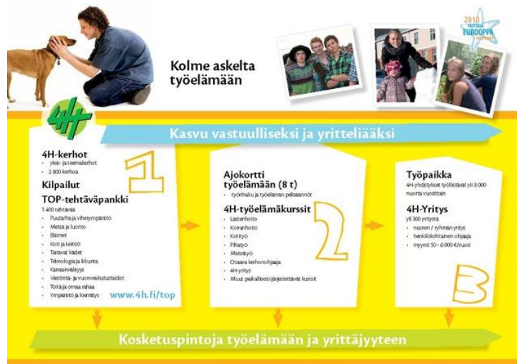
Kuva 1. 4H valtakunnallinen kasvatusajattelu (Suomen 4H-liitto n.d.c)

4H-järjestön yleisiä toimintamuotoja ovat kerhot, leirit, kurssit ja tapahtu- mat sekä työpalvelu ja 4H-yritykset. Näille toimintoille on tarjolla materi- aalia 4H- liiton kautta. Toiminnassa kannustetaan nuoria toimimaan vai- kuttajina ja yrittämään itse. (Vuosikertomus 2012; Suomen 4H-liitto n.d.c)