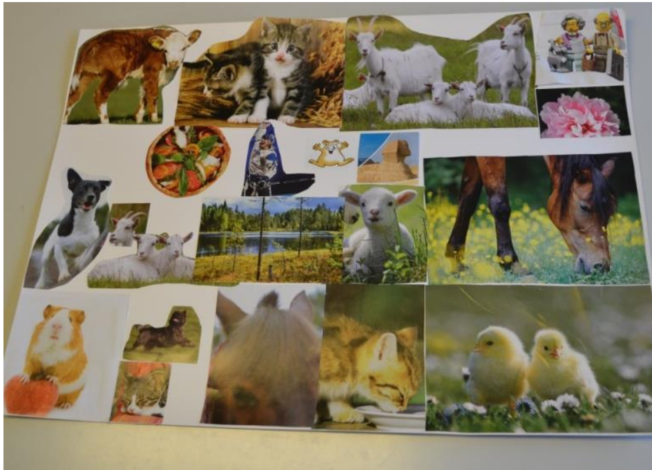
Kuva 8. Työllä kerrottiin vahvasti omat toiveet

Luonto- ja eläinteema on kuvattu tarkasti myös kuvassa 8. Ne ovat 4H toiminnan kulmakiviä ja selkeästi tekijät ovat niistä kiinnostuneita. Mukaan on kuitenkin saatu myös kansainvälisyyteen ja urheiluun sekä ruokaan liittyviä osia. Yhdessä tekeminen ja oleminen ovat varmasti olleet myös mielessä työtä tehtäessä.