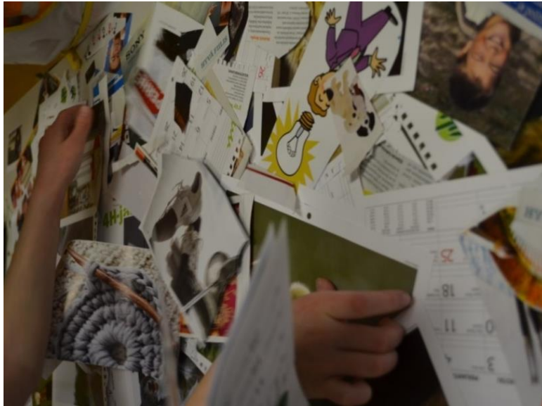
Kuva 3. Kuvien valinnassa tehtiin yhteistyötä

Kuvat aseteltiin pöydälle sattumanvaraisiin järjestyksiin, eikä toiminnan aikana niitä alettu luokittelemaan tai järjestelemään. Aktiivisimman kuvien selauksen ajan, kuvat vaihtoivatkin tiuhaan paikkaa ja omistajaa. Tekijät käyttivät runsaasti aikaa kuvien etsimiseen. Tästä voitiin havaita myös se, että valmiit kuvat palvelivat osallistujia tai sitten sopivaa kuvaa ei heti löytynyt.