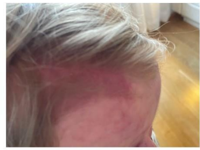
Hoidetun alueen ja hoitamattoman luomen raja