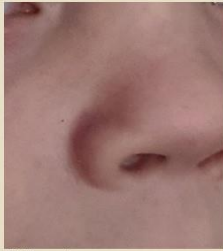
Tuliuomi nenässä.