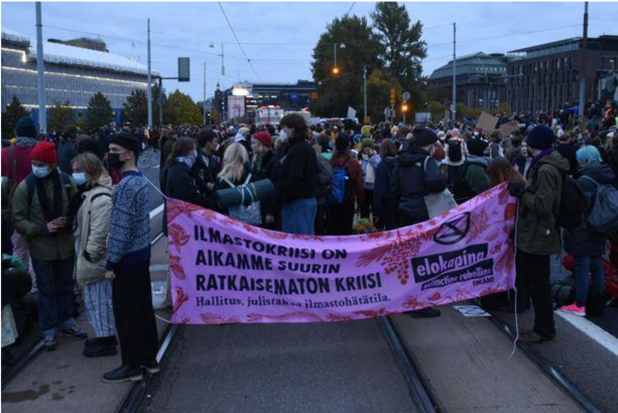
Elokapina vaatii ilmastotoikoja. HENRI KÄRKKÄINEN