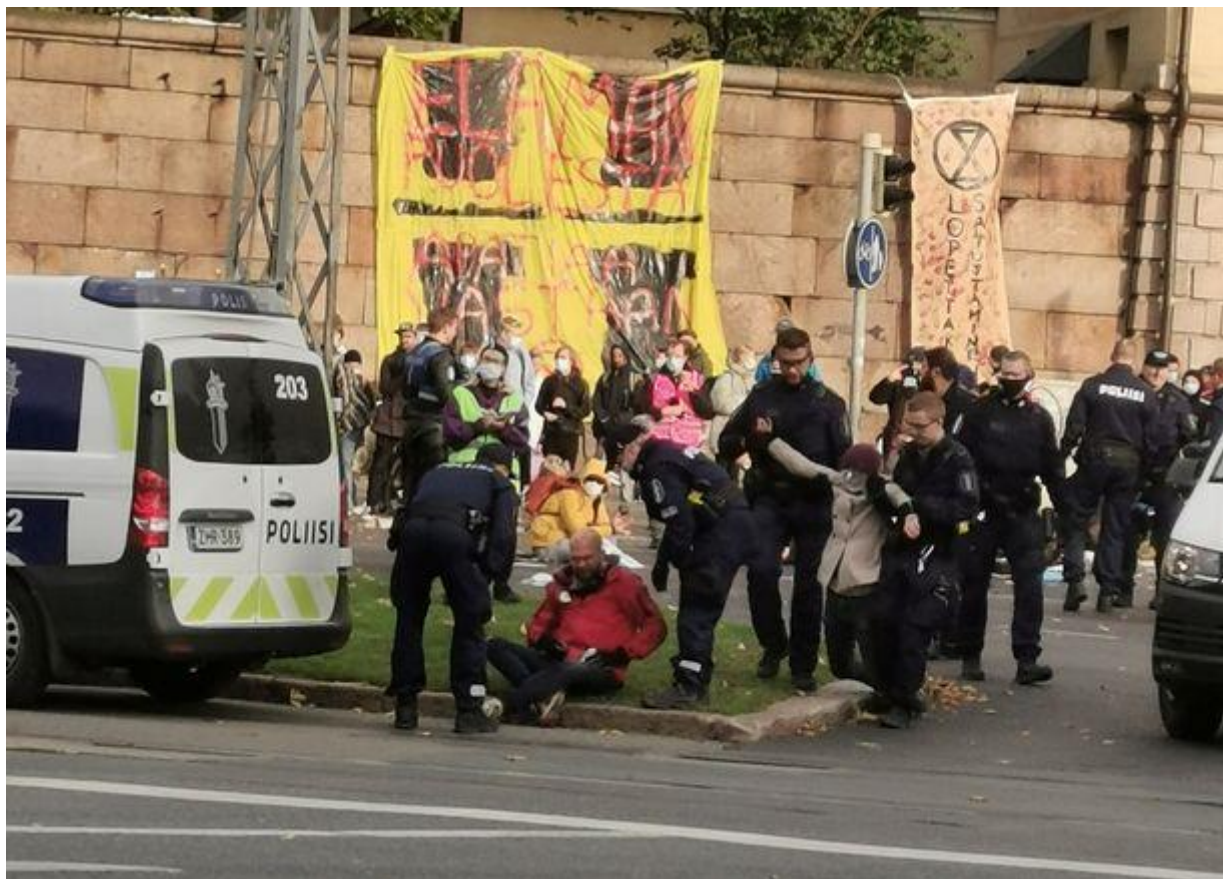
Poliisi kantoi ihmisiä pois tieltä lauantaisesta mielenosoituksesta.