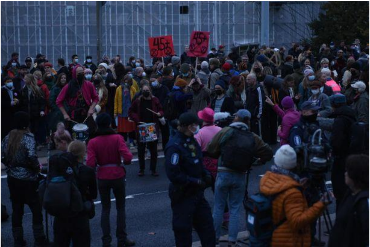
Paikalla on Elokapinan arvion mukaan 300–400 mielenosoittajaa. HENRI KÄRKKÄINEN