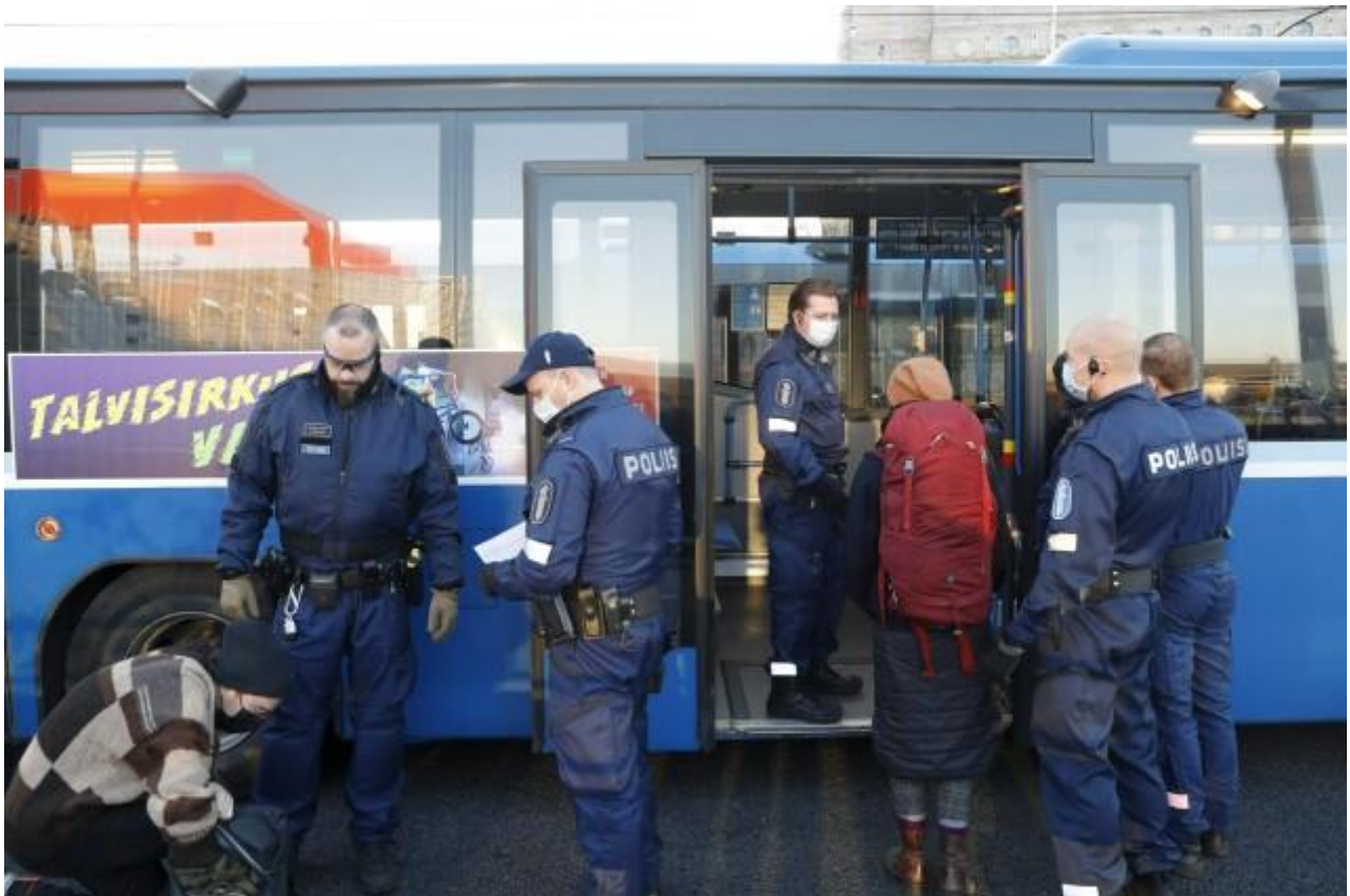
Polisen har sammanlagt gripit cirka 280 personer under miljörelsen Elokapinas demonstration som började i onsdags.