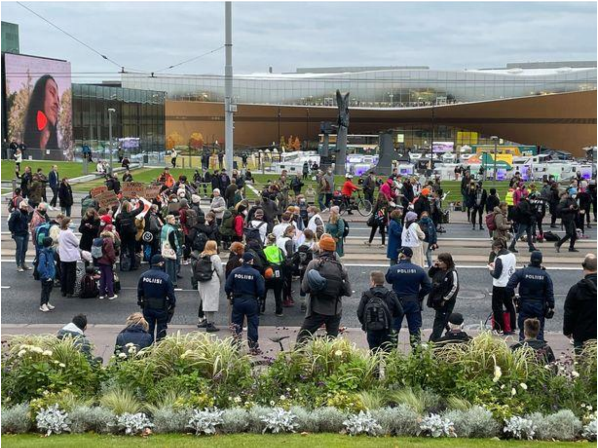
Mielenilmaus keräsi paikalle satoja ihmisiä. MARI JULKU