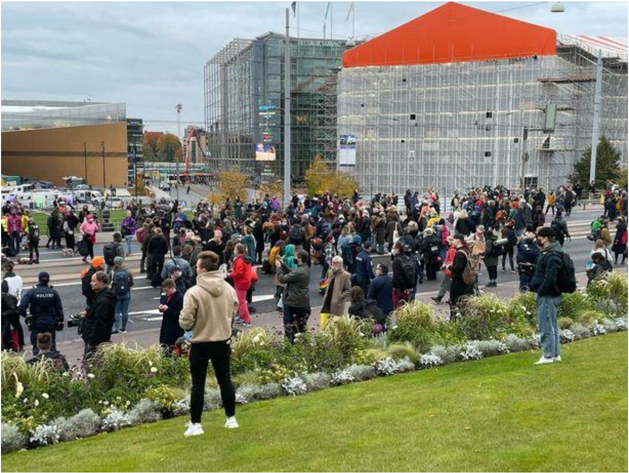
Poliisi käskee Elokapinaa poistumaan. MARI JULKU