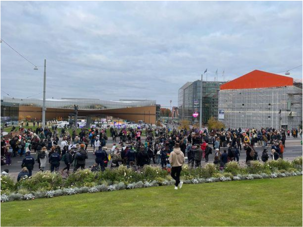
Elokapina vaatii Suomea julistamaan ilmastohätätilan tai se leirytyy kymmeneksi päiväksi Mannerheimintielle. MARI JULKU