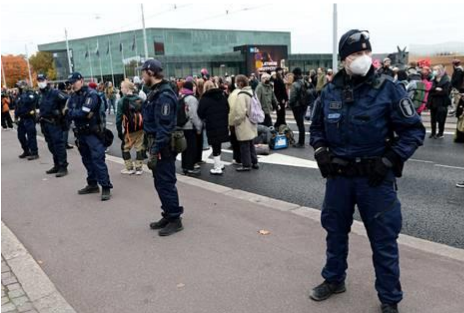
Poliiseja Elokapinan Syyskapina-mielenosoituksessa keskiviikkona.