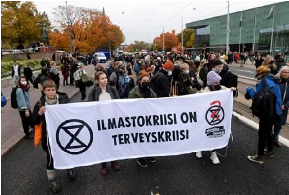
Kello kuuden aikaan keskiviikkona illalla Mannerheimintieellä oli noin sata mielenosoittajaa.