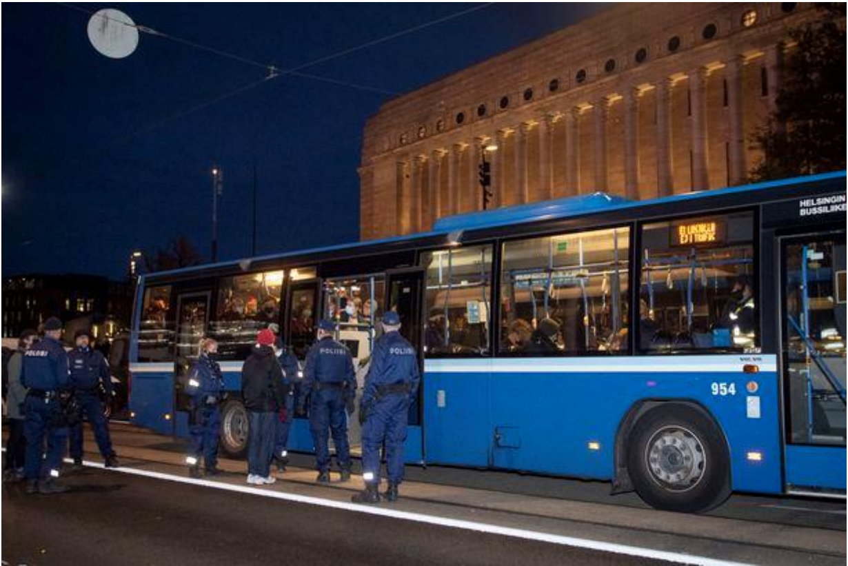
Kiinniotetut henkilöt kuljetettiin pois linja-autoilla. HENRI KÄRKKÄINEN