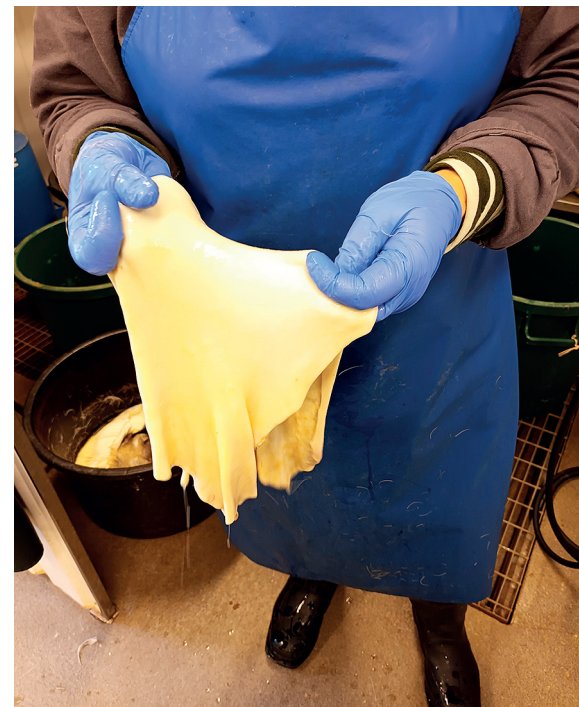
Taljat rahaksi-hankkeessa luodaan prosessikuvaus ja ohjeistus lemmikeille tarkoitettujen tuotteiden valmistukseen porontaljasta. Karvanpoisto on haasteellinen osa purupatukoiden valmistuksessa.