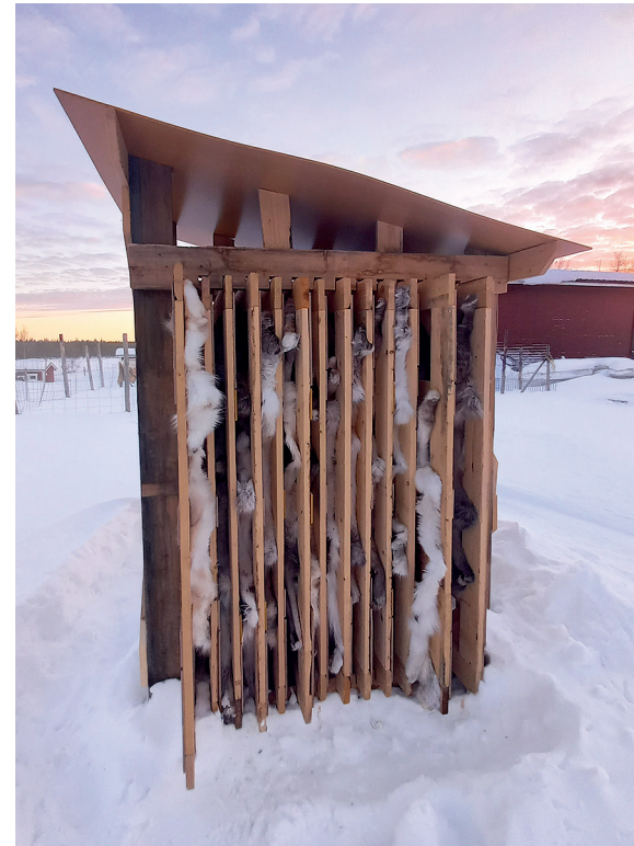
Ilmakuvattuja taljoja voidaan valmistaa massatuotantona erilaisissa telineissä. Niiden, kuin myös muiden taljatuotteiden myynnissä on hyvä ohjeistaa ostajaa tuotteen käyttöön ja säilytykseen.

Hankkeessa on tuotettu yhteistyössä Parasta palkisilta -hankkeen kanssa koipinahkojen talteenottoon ohjaava video (tulee kesän aikana jakoon hankkeen nettisivuille sekä someen). Koipinahkojen talteenottaminen teurastustyön yhteydessä linjastolla mahdollistaa niiden nylkemisen,