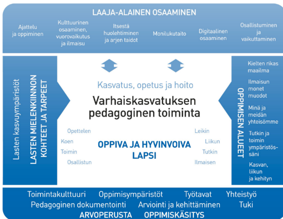
Kuva 1. Varhaiskasvatuksen pedagogisen toiminnan viitekehys (Opetushallitus 2022, 23.)

pohjana. Pedagogiikka perustuu tietoon, joka on erityisesti kasvatus- ja varhaiskasvatustieteellistä. Se on lasten hyvinvoinnin ja oppimisen toteutumiseksi järjestettävää suunnitelmallista ja tavoitteellista ammattihenkilöiden järjestämää toimintaa. Pedagogiikka on näkyvissä kaikessa toiminnassa, hoidon, opetuksen ja kasvatuksen kokonaisuudessa sekä erilaisissa oppimisympäristöissä. (Opetushallitus 2022, 23.) Ajatuksellisella tasolla opetuksen, kasvatuksen ja hoidon tietoinen erottaminen toisistaan on tarpeellinen apu varhaispedagogiikan toteuttamisen sekä kasvatusprosessien suunnittelun ja ymmärtämisen kannalta. Vaikka toiminta voi tapahtua spontaanisti ja aiemman jo opitun tiedon varassa, niin varhaiskasvatus on siltikin tavoitteellista ja toiminnalla on aina jokin tarkoitus. Tämä vaatii kasvattajalta sitä, että hänen pitää ymmärtää omia käytäntöjään sekä sitä mitä hän on tekemässä ja miksi. (Hännikäinen 2013, 50–51.)