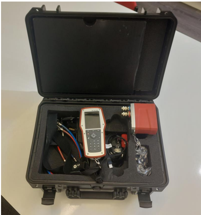
Kuva 7. TA-SCOPE-mittalaite salkussaan [20]

Lämpimän veden kiertojohdon säätö tapahtuu tavallisesti uudiskerrostalossa säätämällä jokainen kiertojohdon haara haluttuun virtaamaan linjasäätöventtiilillä ja optimoimalla kiertovesipumpun toimintapiste. Mittaus suoritetaan linjasäätöventtiilien mittayhteistä esimerkiksi TA-SCOPE-mittalaitteella (kuva 7). Hyvin säädetty kiertojohto ehkäisee äänitekniisiä ongelmia ja säästää energiaa pienentämällä kiertovesipumpun energiankulutusta.