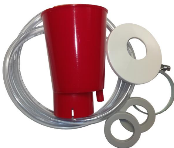
Kuva 3. Näsimuovin valmistama vuodonilmaisinta pystyjakojohtoon [17]

Vesi- ja lämmitysjärjestelmän toteutuksen on mahdollistettava vuotojen havaitseminen, ja rakenteellisten ratkaisuiden on ohjattava vuotovesi näkyville [9]. Käytännössä asennettaessa putkistoja umpinaiseen rakenteeseen edellä mainittu vaatimus toteutetaan yhtenäiseen suojaputkeen asennettavalla putkella tai asentamalla vaatimukset täyttävää vuotovesisuojaalla päällystettyä putkea. Vesijärjestelmässä rakenteelliset vuodonilmaisimet on asennettava vesijärjestelmässä pystyjakojohtoihin jokaiseen kerrokseen. Jos rakenteellisten vuodonilmaisimien käyttö ei ole mahdollista, voidaan niiden sijaan käyttää vuodonilmaisuntureita [9]. Kuva 3 esittää yleistä pystyjakojohtoon asennettavaa vuodonilmaisinta.