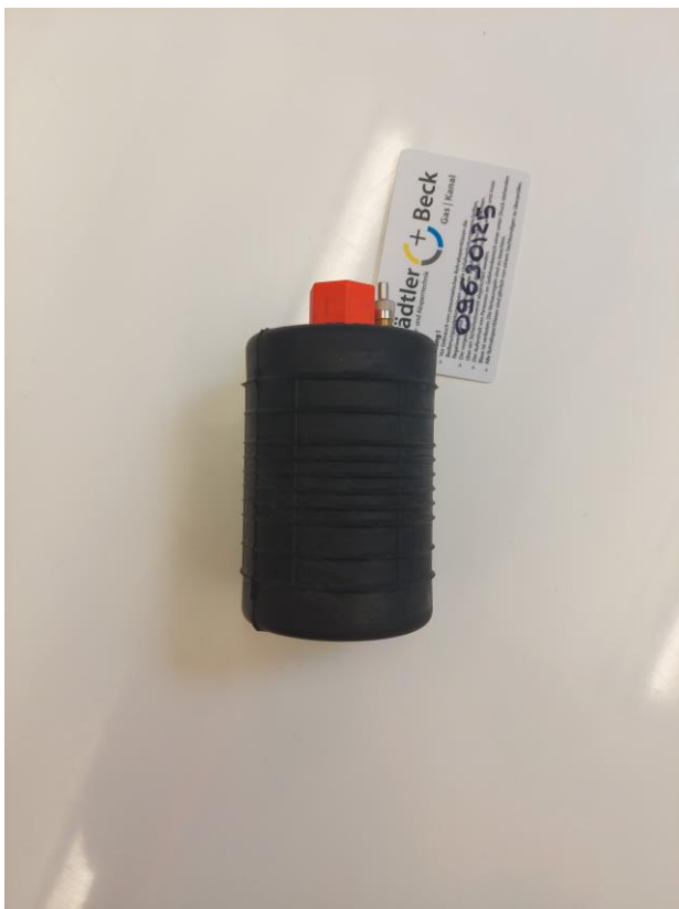
Kuva 5. Sulkutulppa viemärin tiiveyskokeeseen [20]