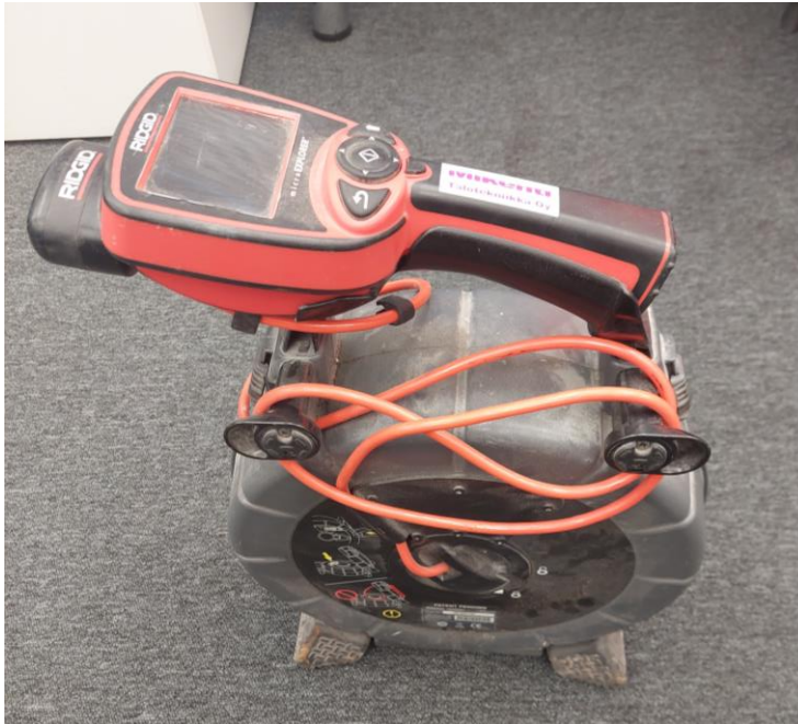
Kuva 4. Ridgid-merkkinen viemärikamera [20]

Hule- sekä jätevesiviemäreiden tiiveys on todettava vedellä tai ilmalla suoritettavalla tiiveyskokeella. Paineviemäriin tapauksessa on koeponnistus pakollinen. [9]