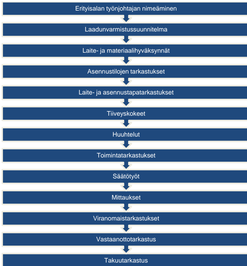
Kuva 2. Laadunvarmistuksen prosessikaavio