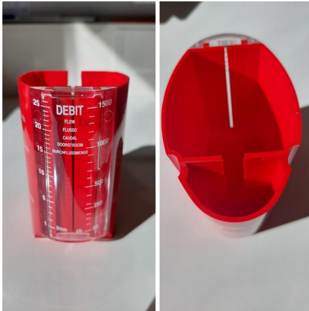
Kuva 6. Oraksen valmistama mitta-astia [20]

Työ aloitetaan selvittämällä suunniteltu sekä toteutunut paine jakojohdossa vesimittarin jälkeen, tarvittaessa painetta kuristetaan paineenalennusventtiilin avulla tai korotetaan paineenkorotusasemalla suunniteltuun arvoon. Kun kiinteistön vesijohtoverkosto on suunnitellussa paineessa, mitataan virtaama kalusteesta, joka on suurimman painehäviön takana. Tarvittaessa vesijohtoverkoston painetta korotetaan tai lasketaan, jotta vesimittarilta katsottuna suurimman painehäviön omaava kaluste saadaan riittävän lähelle mitoitusvirtaamaa. Jakojohdon sopivan painetason löydyttyä kierretään vesikalusteet läpi mittalaitteen avulla ja tulokset kirjataan tarkastusasiakirjaan.