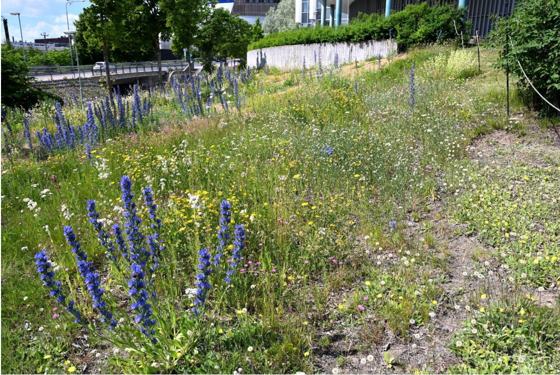
Kuva 15. Tampereen yliopiston alaniitty 2 kesällä 2022 (Sanna Särkinen, 2022).