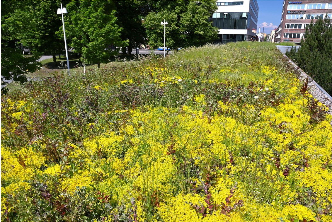
Kuva 27. Tampereen yliopiston viherkatto kesällä 2022.