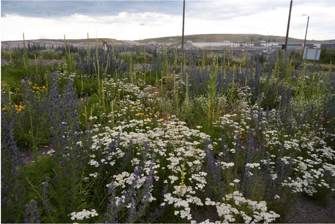
Kuva 24. Ämmäsuon ekoteollisuusalueen tilanne ja alueen infokyltti kesällä 2022 (Sanna Särkinen, 2022)