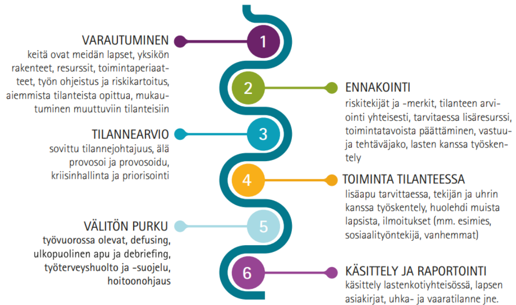
Kuvio 2. Turvallisesti sijaishuollossa. Väkivallan hallinnan keinoja ja väkivaltaosaamisen vahvistaminen. (Hoikkala & Kuokkanen 2017, 50.)

Konkreettisia toimintatapamalleja voidaan myös käyttää sijaishuollossa aggressiivisissa tai uhkaavissa väkivaltaisissa tilanteissa, joista tunnetuin on varmasti Avekki-toimintamalli. Se on kehitetty työyhteisön uhka- ja väkivaltatilanteisiin. Toimintamalli koostuu sanoista aggressio, vuorovaikutus, ennaltaehkäisy, kehittäminen, koulutus ja integrointi, jotka kuvaavat hyvin myös sijaishuollossa kohdattua väkivaltaa. Avekki-toimintamallin lisäksi käytettyjä toimintamalleja sijaishuollossa ovat hallittu fyysinen rajoittaminen, hoidollinen kiinnipito, Mapa-menetelmä haasteellisen käytöksen ennaltaehkäisyssä ja hallinnassa sekä Part-menetelmän pohjalta kehitetty väkivaltatyö. Kaikissa toimintamalleissa ja menetelmissä korostetaan sitä, että kouluttautuminen kaikkien menetelmien käyttöön on ehdotonta ja koulutuksia myös ylläpidetään ajoittain. Toimintamalleissa korostetaan myös toiminnan yksilöllistä mukauttamista tilanteen ja yksilön mukaan sekä menetelmän käytön arviointia tilanteen mukaan. (Hoikkala & Kuokkanen 2017, 51-72.)