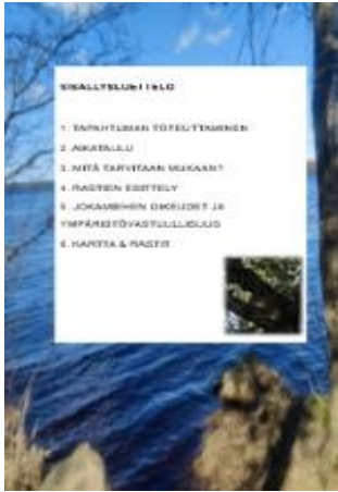
KUVA 2. Green Care -ohjaajan käsikirjan sisällysluettelo.

tai selkeitä arabialaisia numeroita (kuva 2). Koska ohjaajan käsikirja on lyhyt, siinä ei ole käytetty sivunumerointia. Käsikirjan pelkkien otsikoiden perusteella saa sisällöstä kokonaiskäsityksen. Käsikirjan fonttina on Arial 12–28, mikä on selkeä sekä helppolukuinen.