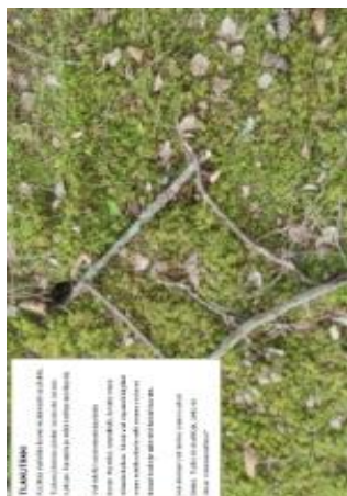
KUVA 5. Yksi käsikirjan rasteista.

Tekstin korostamisessa ei ole käytetty värejä, mutta kuvien ja kuvioiden värit on mietitty luontoteemaan sopivaksi ja niin, että riittävien kontrastien avulla oleellinen tulee selkeästi esille. Väreillä ei kuitenkaan tuoda esille oleellista tietoa, mitä ilman värejä ei saisi. Rastien kuvat selkeyttävät rasteja (kuvassa 5), joten rastien toteuttaminen vaatii hieman näkökykyä tai jonkun ryhmästä selkeyttämään rastia. Tämä voi olla ryhmän ohjaaja tai toinen kuntoutuja.