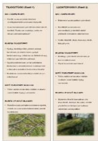
KUVA 4. Ohje parista rastista.

Tekstin korostamisessa ei ole käytetty värejä, mutta kuvien ja kuvioiden värit on mietitty luontoteemaan sopivaksi ja niin, että riittävien kontrastien avulla oleellinen tulee selkeästi esille. Väreillä ei kuitenkaan tuoda esille oleellista tietoa, mitä ilman värejä ei saisi. Rastien kuvat selkeyttävät rasteja (kuvassa 5), joten rastien toteuttaminen vaatii hieman näkökykyä tai jonkun ryhmästä selkeyttämään rastia. Tämä voi olla ryhmän ohjaaja tai toinen kuntoutuja.