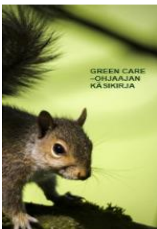
KUVA 1. Green Care -ohjaajan käsikirjan kansi.

Ohjauksen kansikuvaksi valikoitui (kuvan 1) orava, koska se sopii hyvin luontoteemaan ja on yhteistyökumppanin maskottieläin. Oravan kuva löytyy jokaiselta käsikirjan sivulta. Myös muissa värimaailmoissa ja kuvissa on huomioitu luontoteema. Rastien kuvat on otettu itse miettien rastien teemaan sopivaksi, mutta jättäen varaa myös mielikuvitukselle.