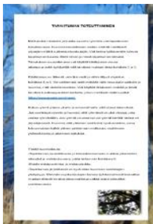
KUVA 3. Ohje tapahtuman toteuttamiseksi.

Ohjaajan käsikirjassa käytetyt verkkolinkit ovat alkuperäisessä muodossa, koska käsikirja on tarkoitettu tulostettavaan muotoon. Ohjaajan käsikirja haluttiin pitää selkeänä, mutta samalla toimia tietopakettina tapahtuman järjestäjälle (kuva 3). Verkkolinkit erottuvat selkeästi muusta tekstistä värillä ja alleviivauksella (Saa-vutettavasti.fi n.d b.) Linkkien kautta löydät päivittyneen tiedon kyseisestä asiasta. Opinnäytetyön teoriaosuudessa kuviin on lisätty vaihtoehtoinen teksti.