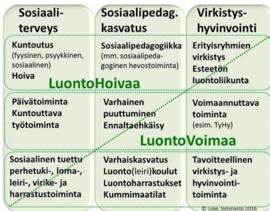
KUVIO 2. Luonto Hoiva & Luonto Voima. Lountolähtöisiä toimintamuotoja sovelletaan eri palveluissa ja ne voivat kuulua monelle eri toimialalle. (Green Care Finland n.d.)

Green Care -toiminnassa noudatetaan sosiaali- ja terveysalan lakia ja säädöksiä. Luonto hoivan palvelut ovat erityispiiriin kuuluville asiakkaille, ja terapia on useimmin pitkä kestoista. Luonto hoivassa vahvistetaan osallisuuden, toimintakyvyn sekä arjen hallinnan toimintaa. (Suomi jne. 2016, 9.)