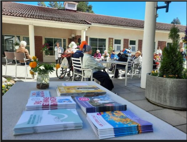
KUVA 3. Oulun seudun omaishoitajat ry (Hernberg 2022)

sanoi olevansa valmiina vastaamaan mieltä askarruttaviin, omaishoitoon liittyviin kysymyksiin. Yhdistyksellä oli myös esittelypöytä, jossa oli kirjallista materiaalia (KUVA 3).