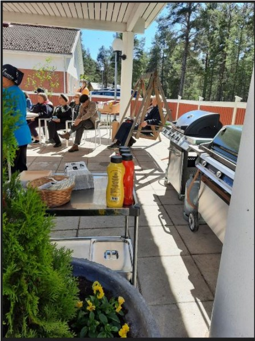
KUVA 4. Makkaratarjoilu (Vähäkangas 2022)

Juhlan aloituspuheessa olin kertonut palautteen keräämisestä. Ilmoitin jakavani tässä vaiheessa palautelomakkeet (LIITE 2), johon sai antaa risuja ja ruusuja. Perustelin palautteen merkitystä opinnäytetyölleni. Samalla kun nautittiin tarjoilusta ja kirjoitettiin palautteita, hanuristi kiersi yleisön joukossa soittamassa. Tunnelma oli todella hieno. Viimeisenä ohjelmanumerona oli kevyt tuolijumppa, jossa teimme yhdessä mielikuvaretken kesämökille pyörällä ja soutuveneellä. Kotihoidon hoitaja ei ehtinytkään paikalle sitä ohjaamaan, joten minä toimin sijaisena, näytin edessä mallia ja hyvin saimme tehtyä retken jumpaten. Liikkeet valitsin kaikille sopiviksi. Ne olivat helppoja ja istualtaan tehtäviä. Näin jokainen pystyi osallistumaan yhteisjumppaan omalla toimintakykytasollaan.