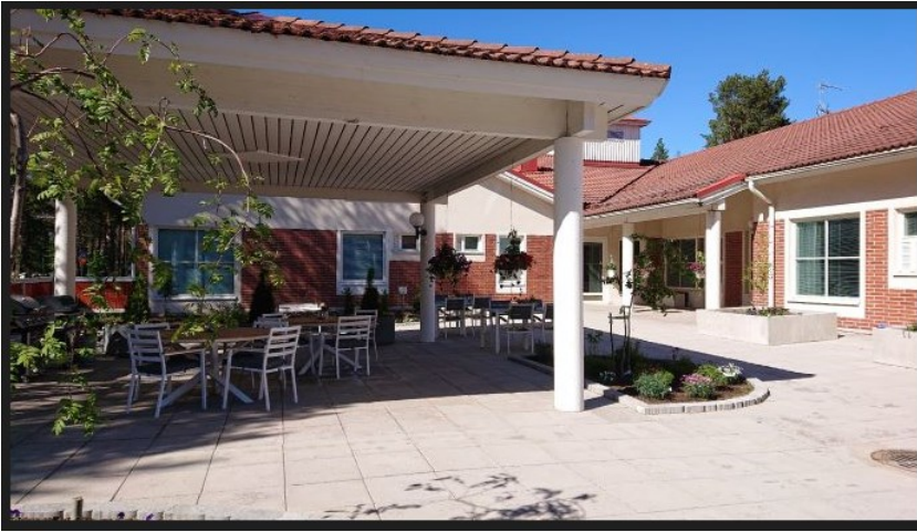
KUVA 2. Saarenkartanon sisäpiha (Vähäkangas 2022)

avuksi koristelussa. Aurinko paistoi kirkkaan siniseltä taivaalta. Kaikki oli valmiina juhlapaikalla, vain yleisö puuttui (KUVA 2).