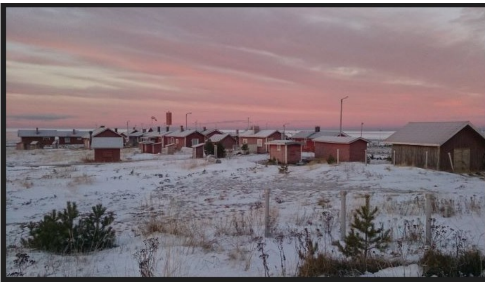
KUVA 1. Marjaniemen vanha kalastajakylä (Vähäkangas 2022)

on sosiaalisia suhteita arjessaan. (Räsänen 2011, 118.) Täällä Hailuodon pienessä kunnassa yhteisöllisyyden tunne on voimakas. Hailuoto on noin 1000 asukkaan saariyhteisö Perämerellä lähellä Oulua. Yhteisöllisyydellä on iso merkitys kuntalaisten arjessa. Kaikki tuntevat toisensa ja asukkaiden keskuudessa elää edelleen voimakas saaristolainen me-henki. Saarella on ennen säännöllistä lauttaliikennettä asuttu enemmän tai vähemmän eristyksissä vuodenaikojen mukaan. Ennen kalastuksella oli merkittävä rooli saarelaisten elämässä. Pienissä kalastajamökeissä vietettiin kalastuskaudella pitkiäkin aikoja yhdessä (KUVA 1). Tuohon aikaan Marjaniemeen ei ollut kunnan tietä, vaan se oli kaukana saaren vakituisesta asutuksesta. Toisia autettiin, kun siihen oli tarvetta. Olosuhteet muokkasivat jokaisen elämää ja se lisäsi saarelaisten yhteisöllisyyttä.