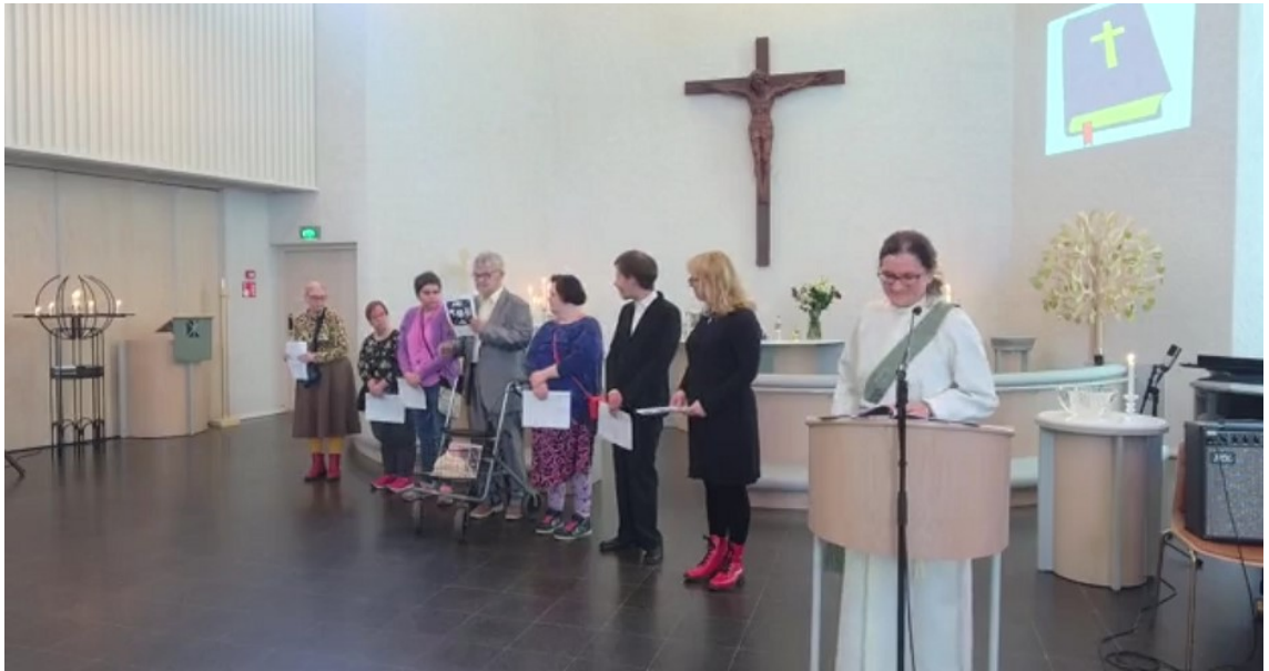
Kuva 2. Vapaaehtoiset mukana toteuttamassa esirukousta.

Kuvassa (Kuva 2) kehitysvammaisia mukana toimijoina isänpäivämessun esirukouksen toteutuksessa yhdessä diakonin ja ohjaajan kanssa. Kehitysvammaiset kokivat tärkeänä osallistumisen esirukoukseen. Messun toteutuksessa korostui selkokieli ja selkokuvat.