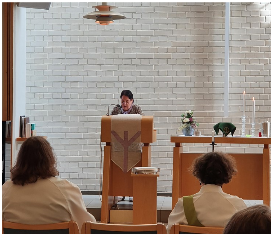
Kuva 4. Vapaaehtoinen lukemassa Raamatun tekstiä.

Kuvassa (Kuva 4) seurakunnan vapaaehtoinen lukemassa Raamatun tekstiä Lähiömessussa. Vapaaehtoiset kokevat erilaiset tehtävät tärkeinä messun toteutuksessa. Kuvan vapaaehtoinen koki tehtävänsä tekstin lukemisessa messussa erityisen tärkeäksi.