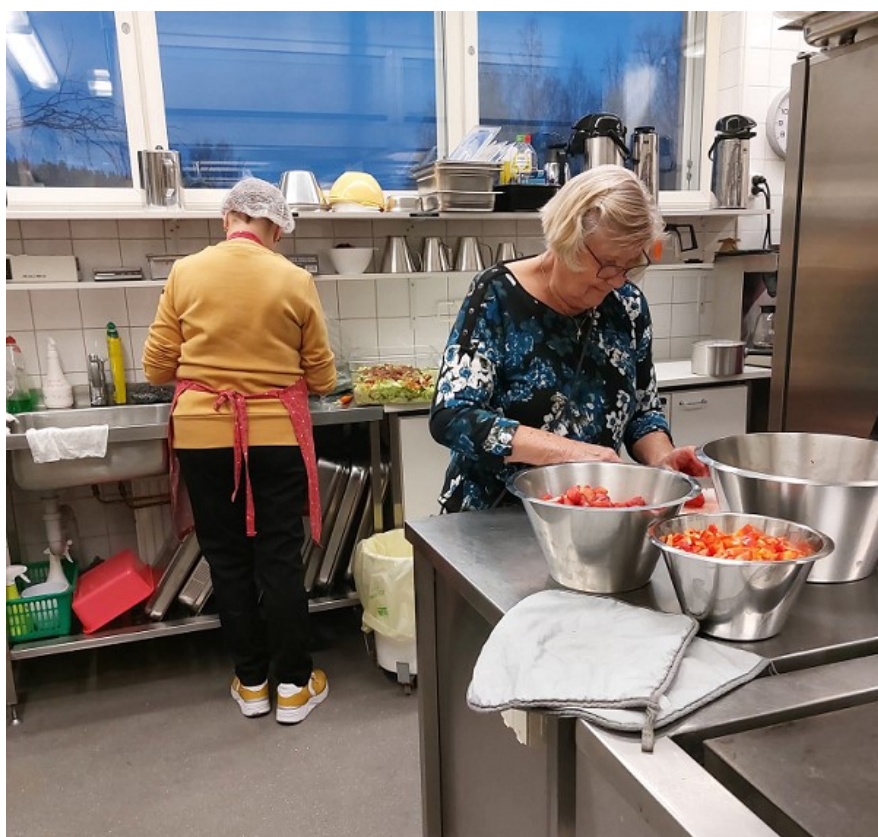
Kuva 5. Vapaaehtoiset valmistamassa messun jälkeen tarjottavaa soppaa

Kuvassa (Kuva 5) vapaaehtoiset tekemässä soppaa, joka tarjottiin messuun osallistujille soppakirkon lopuksi. Sopian tarjoaminen messun jälkeen koettiin erityisen tärkeäksi diakonisissa messuissa. Sopian valmistamisesta vastasi seurakunnan vapaaehtoiset, jotka valmistivat ruuan ja laittoivat sen tarjolle seurakuntalaisille.