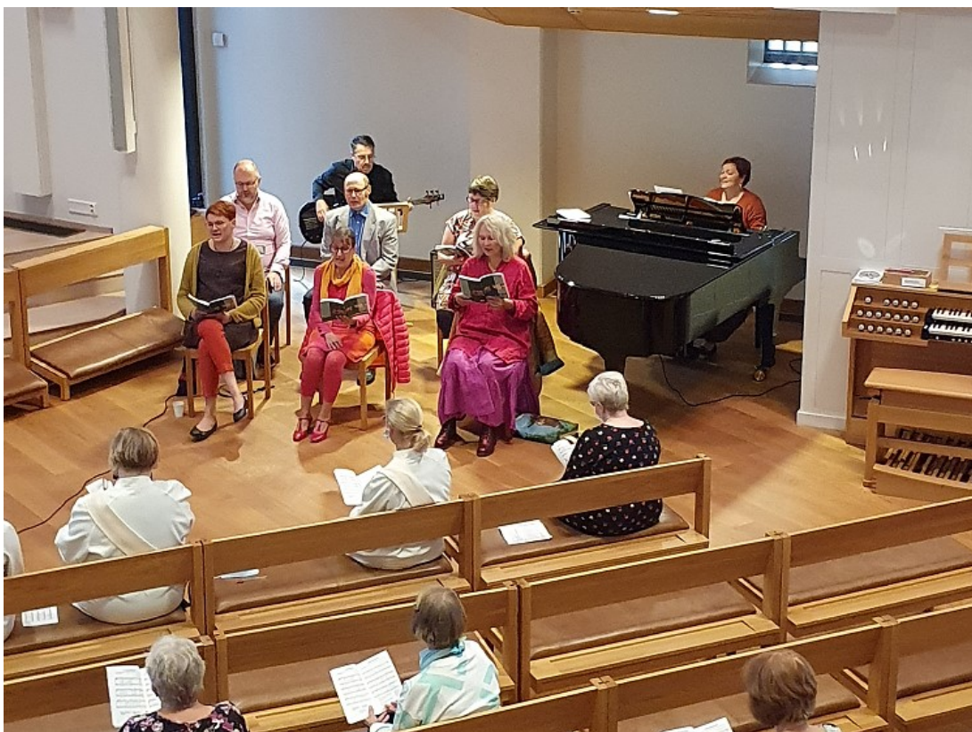
Kuva 3. Vapaaehtoisten kuoro esiintymässä messussa.

Kuvassa (Kuva 3) seurakunnan vapaaehtoisten musiikkikuoro, joka esiintyi Tuomasmessussa kanttorin johdolla. Kuoro koostuu seurakunnan vapaaehtoisista, jotka ovat aktiivisissa toimijoita messussa. Kuoro toimii esilauluryhmänä ja seurakunnan laulun tukija muulle seurakunnalle.