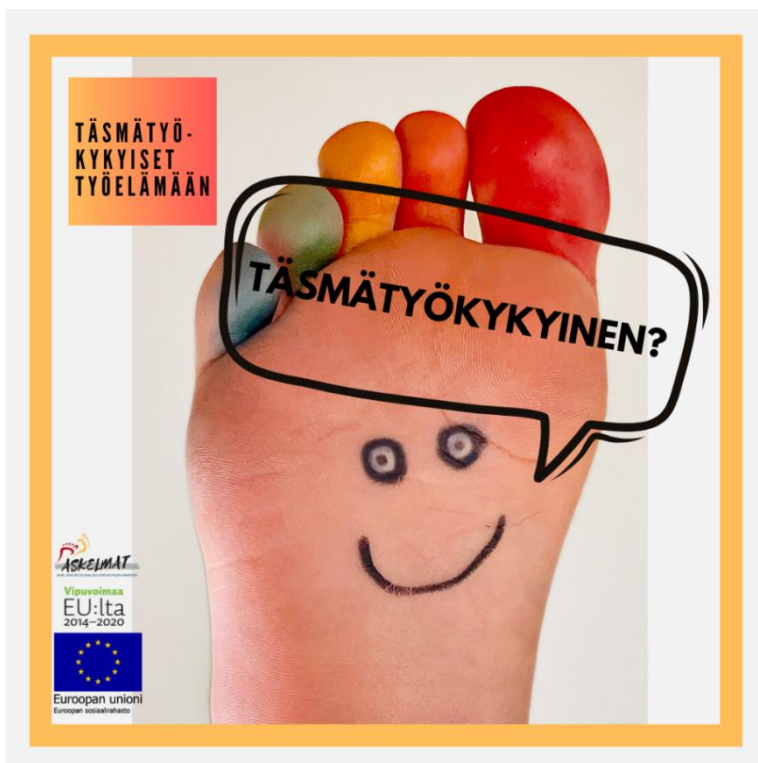
Kuva 2. Täsmätyökykyiset työelämään -logo.