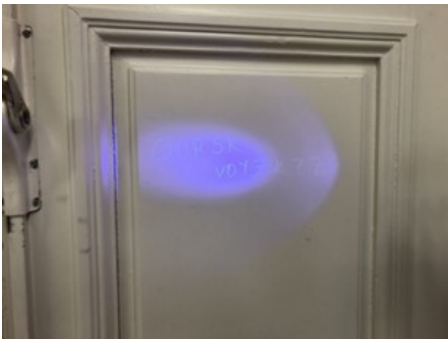
Kuva 3. Salakirjoitusta koulun sisäovessa.