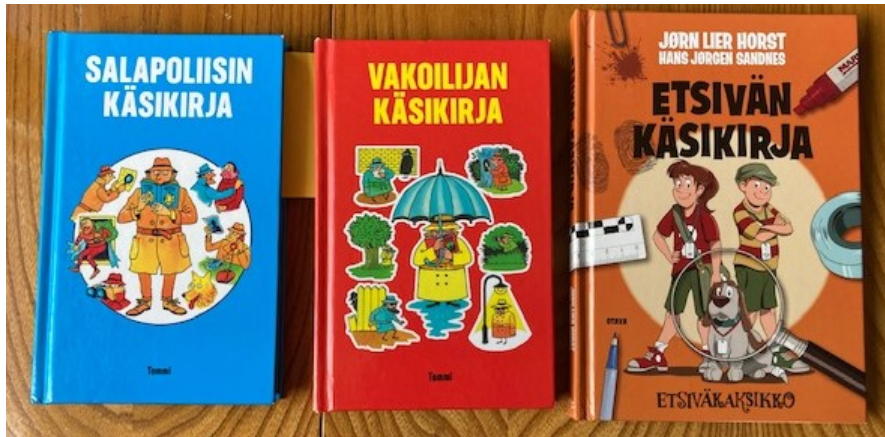
Kuva 4. Kirjoja, joista Markku Savolainen ottaa ideoita kerhon tehtäviin.

Savolainen näkee paljon vaivaa sen eteen, että saa kerhon sisällön lapsia kiinnostavaksi. Lukematomat ideansa tehtäviin hän ammentaa paitsi omasta, monipuolisesta kokemuksestaan, niin myös erilaisista, lapsille suunnatuista salapoliisikirjoista (kuva 4.).