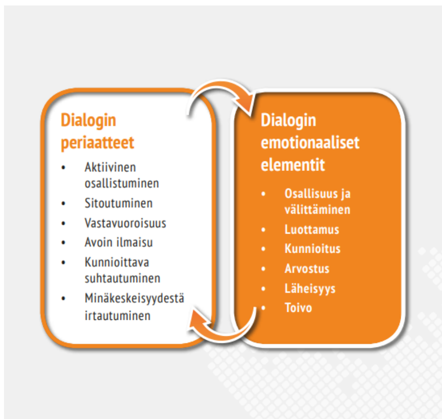
KUVA 2. Kohti dialogista vuorovaikutusta. (Fedotoff, Leppäkari & Timonen 2016.)

kykenee tekemään omat ratkaisunsa. Dialogisessa kohtaamisessa on tärkeää olla oma itsensä, rehellinen ja avoin. Dialogin onnistumisen kannalta tulee luopua ennako-oletuksista ja tiedosta ja se vaatii osallistujilta luottamusta ja emotionaalista sitoutumista. Yhteisyyttä dialogiin luo tietämättömyys ja epätäydellisyys. Asioita mietitään ja ihmetellään yhdessä, eikä valmiita vastauksia siis ole. Tunteiden ilmaisu ja jakaminen on dialogisuudessa jopa toivottua. Nuorisotyössä dialogin tavoitteena onkin ymmärtää nuoren omaa näkökulmaa. Tämä onnistuu parhaiten kuuntelun, läsnäolon sekä aktiivisen vuorovaikutuksen kautta, näin nuorta tuetaan näkemään omat voimavaransa ja toimijuus itsessään. Nuoren omakuva vahvistuu näkemisen ja kuulluksi tulemisen avulla. (Fedotoff, Leppäkari & Timonen 2016.)