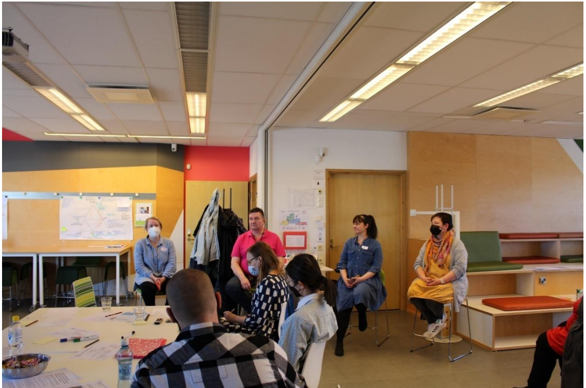
Kuva 2. Ennakointidialogi (Kuva Kähkönen 2022).

Neljännessä yhteisöpajassa pureuduttiin muutuskokeiluiden kehittämiseen. Haasteita kartoitettiin, prosessia selkeytettiin ja valittuihin muutuskokeiluihin sitouduttiin. Ryhmät neuvoivat toisiaan, ja osallistujista koostuneesta asiantuntijapaneelistä nostettiin yksittäisiä puheenvuoroja. Asiantuntijapaneelissa käsiteltiin edellisellä kerralla esiin nousseita haasteita.