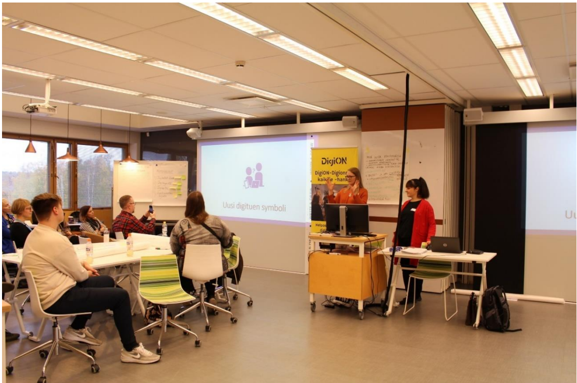
Kuva 3. Uusi digituen symboli esiteltiin osallistujille ensimmäistä kertaa viidennessä yhteisöpajassa.

Viidennessä ja viimeisessä yhteisöpajassa käsiteltiin kokeilujakson tuotoksia. Jokainen ryhmä pääsi vuorollaan esittämään oman prosessinsa tulokset (Kuva 3). Tulosten myötä pohdittiin kokeiluiden juurruttamista toimintaan, ja kartoitettiin konkreettisia keinoja juurtumisen varmistamiseen. Esiin tuli halu jatkaa toiminnan kehittämistä, ja ryhmien tulevaisuutta pohdittiin yhteisöpajojen päättymisestä huolimatta. Lopputuloksena ryhmille jäi jatkosuunnitelma omaa toimintaansa koskien. Yhteisöpajatyöskentely koettiin positiivisesti yllättävänä, konkreettiansa vuoksi. Osallistujat pitivät työskentelyn tavoitteellisuudesta ja ammattimaisuudesta, myös jokaisen osallistujan sitoutumista toimintaan keuhuttiin.