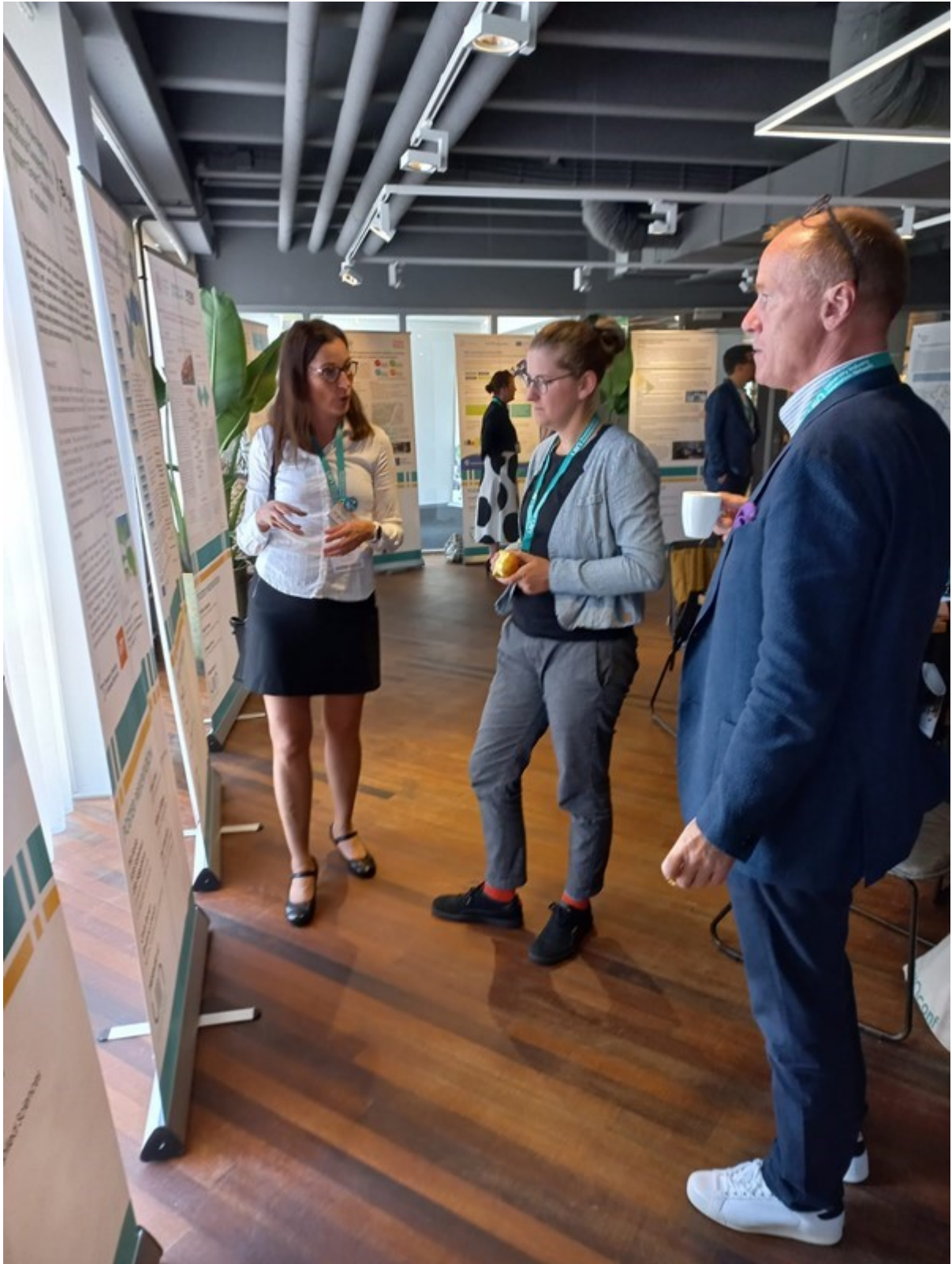
Posterin äärellä keskusteltiin niin kestävästä pakkausmateriaaliratkaisuista kuin opiskelijoiden osallistamisesta tutkimus- ja kehitystyöhön.