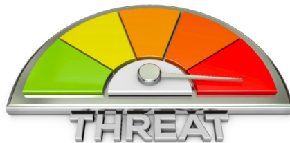
Liite 6. Traumainformatiivisuus lähihoitajan työssä