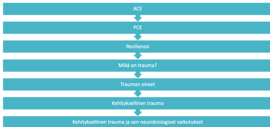
Liite 12. Sisällys