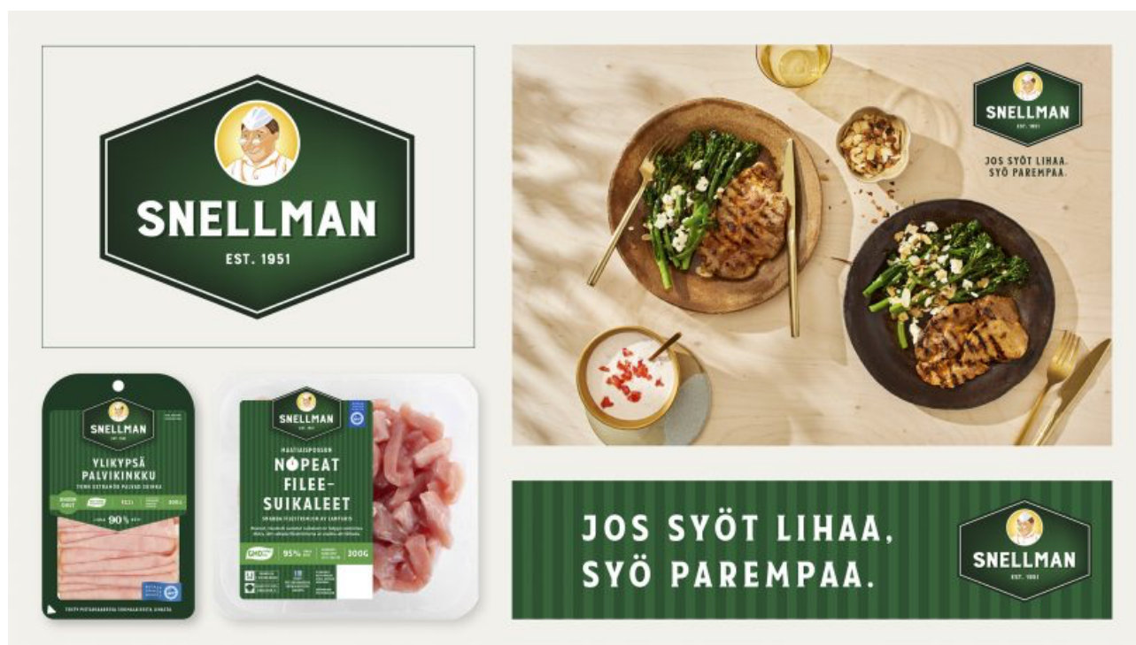
Kuva 5. Snellmanin uusittu logo ja pakkaukset (Snellman 2021 a)

Suomalainen elintarvikealan yritys Snellman perustettiin Pietarsaaressa vuonna 1951. Yrityksen tuotteisiin kuuluu lihajalosteiden lisäksi valmisruoat. (Snellman, 2022).