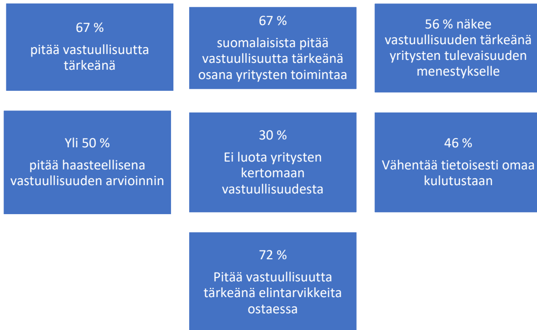
Kuvio 1. Otteita Sanoman vastuullisuuskartasta, (Sanoma 2021)

Sanoman vastuullisuustutkimuksesta käy ilmi, miten suomalaiset kuluttajat ostopäätöksiään tekevät. Vastuullisuus on selkeästi nostanut päätään. Kuten kuvio 1 näkyy, niin 67 % kuluttajista pitää vastuullisuutta tärkeänä ostopäätöstä miettiessä, on yritysten viestintäammattilaisten oltava heillä. Vastuullisuuskartasta (kuvio 1) voidaan huomata, että 56 % kuluttajista pitää vastuullisuutta yhtenä kulmakivistä koskien yrityksen menestyksestä tulevaisuutta. Myös 46 % vähentää tietoisesti omaa kulutustaan, joka kertoo siitä, että kuluttaja on valmis itsekin ”uhrauksiin” vastuullisuuden edessä. Tutkimuksen mukaan kuluttajat vaativat niin suurilta kuin pienneiltäkin yrityksiltä vastuullista liiketoimintaa.