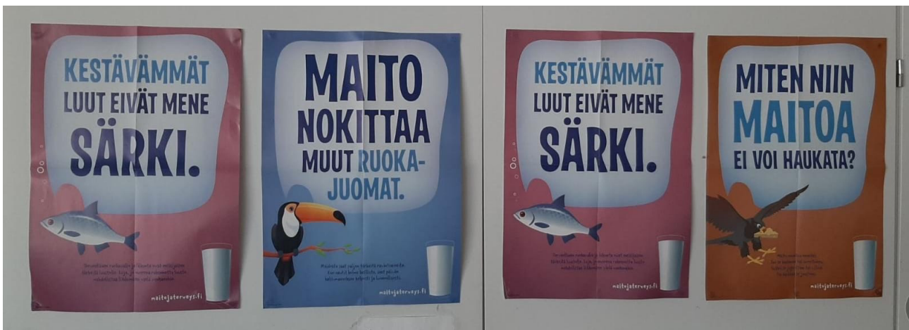
Kuva 4. Maitoteollisuuden mainontaa koulussa 2000-luvulla (Toivonen 2021)

Toisesta näkökulmasta katsottuna vastuullisuus oli heikossa kantimissa kampanjaa seurattaessa. Lapsiin kohdistuva mainonta on vaikea aihe, vaikka yritys perustelikin päätöstä sillä, että tiedot ja ajatukset maidosta juurrutetaan lapsiin jo hyvin aikaisin. Mielestäni on hyvä, että lapsiin kohdistuvan mainonnan suhteen ollaan tiukka, jotta lapset altistuisivat nuorena mahdollisimman vähän mainonnalle. Toisaalta on erikoista, että Oatlyn mainonta koskien maitoteollisuutta oli hyvän tavan vastainen, vaikka perinteiset maitotuotteet ovat olleet varsinkin koululaitoksissa esillä lapsille mainoksien kautta. Oatlyn Linda Nordgren kertoo kampanjan suuntautuneen ensisijaisesti lasten vanhemmille ja pitää ihmeellisenä sitä, että maitoteollisuus on saanut harjoittaa mainontaa kouluissa jo vuosikymmenten ajan. (Yle, 2021).