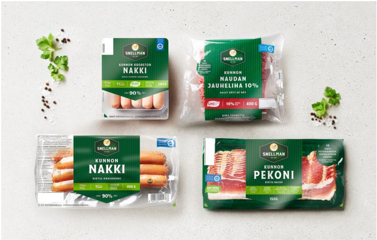
Kuva 7. Snellmanin Kunnon-tuotesarja (Snellman 2022 a)

kovien paineiden kohteena, alan eettisyyden ja ekologisuuden näkökulmasta on suomalaisen liha-teollisuuden toiminnassa nähtävissä myös valonpilkahduksia.