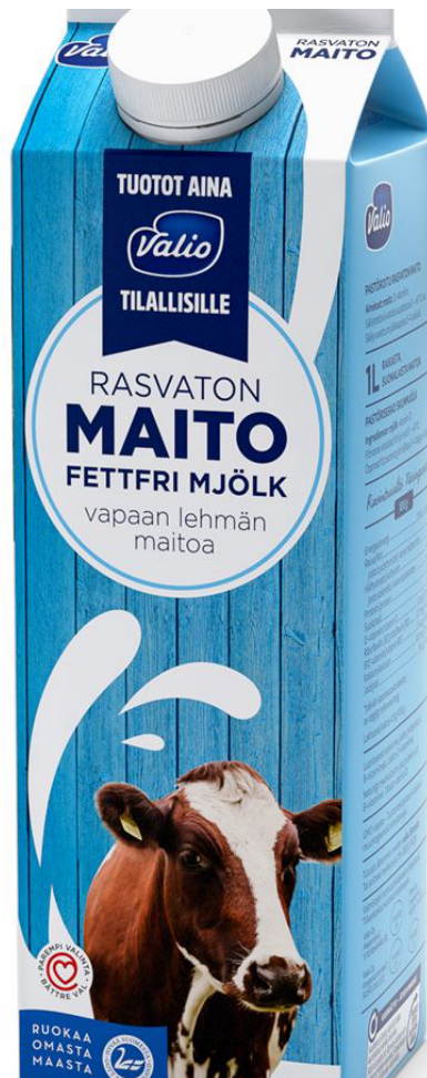
Kuva 10. Valion "vapaan lehmän" maitotölkki (Valio 2022 e) https://www.valio.fi/tuotteet/valio-vapaan-lehman-rasvaton-maito/

Kuten kuvasta 10 havaitaan, Valio myy maitoa "vapaan lehmän" tuotoksena, vaikka lehmät eivät pääse ulkoilemaan vapaasti tuotantotiloilla. Valion (2020 b) mukaan noin 60 prosentille lehmistä on järjestetty laiduntamis- tai ulkoilumahdollisuus. Kyseisessä tapauksessa Valion harjoittama markkinointi on selkeästi harhaanjohtavaa. Vapaan lehmän maito herättää kuluttajassa herkästi positiivisen ajatuksen lehmän hyvinvoinnista. Markkinoinnin takaa paljastui kuitenkin hieman toisenlainen kuva tuotantoprosessista, jolloin voidaan todeta, että Valion toiminta ei ole ollut tämän tapauksen kohdalla vastuullista.