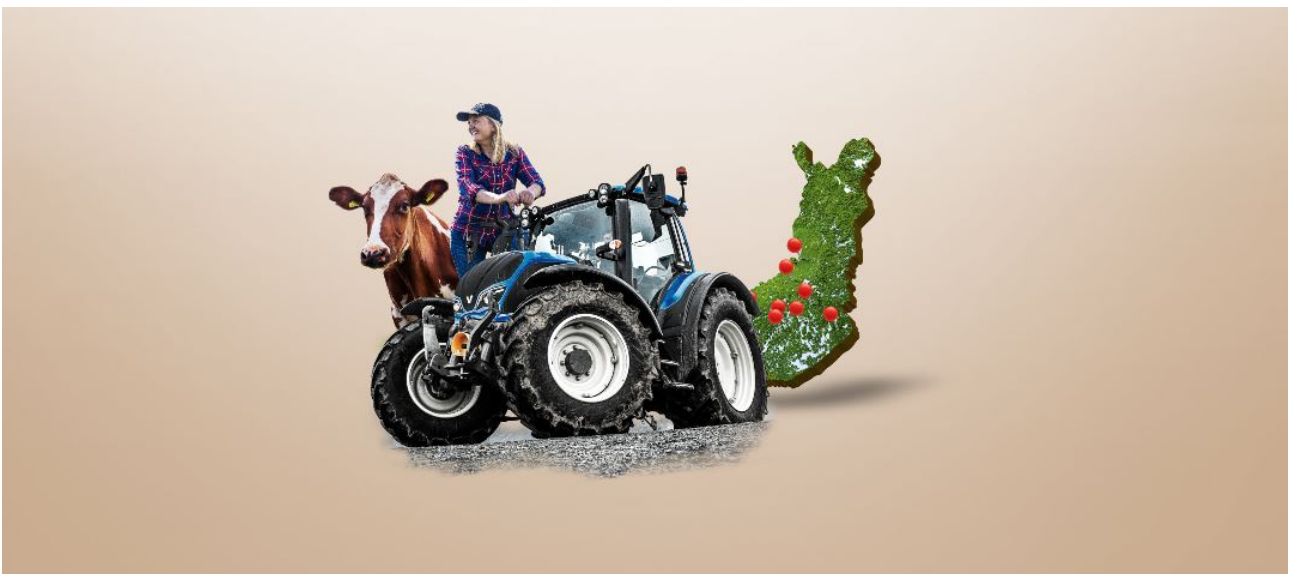
Kuva 9. Hyvää työtä ja huomenta-kampanjan mainoskuva (Valio 2020 a)

Valio käynnisti vuonna 2020 Hyvää työtä ja huomenta-kampanjan, jonka tarkoituksena oli avata kuluttajalle miltä näyttää työ suomalaisen ruoan parissa ja kunnioittaa ruoan tekijöitä.