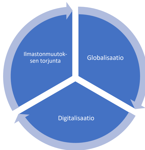
Kuvio 2. Tulevaisuuden arvokkaimpien brändien rakennuspalikat (Lillberg & Mattila 2020, 18)

tulevaisuudessa arvokkaimmat brändit ovat maailmanlaajuisia, aallonharjalla digitalisaation suhteen ja pyrkivät omalla toiminnallaan ilmastonmuutoksen torjuntaan.