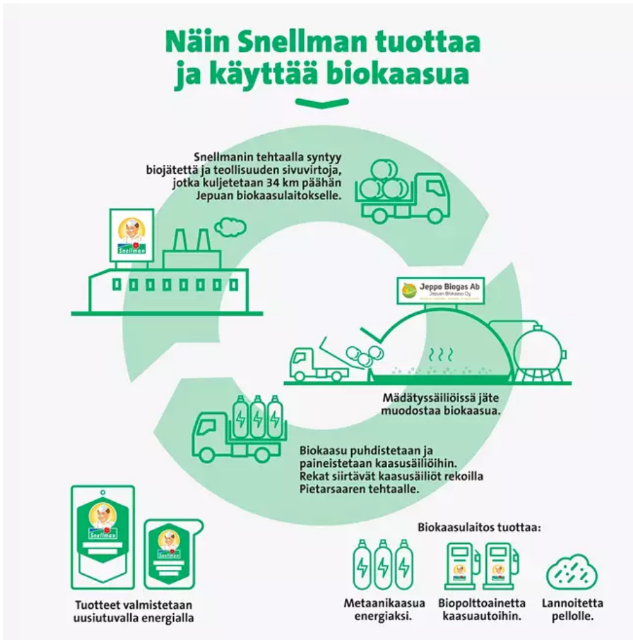
Kuva 6. Snellmanin biokaasun käyttöprosessi (Iltasanomat 2021)

Snellman on visioinut, että se haluaa korvata toiminnassaan käytettävät fossiiliset polttoaineet uusiutuvalla energialla, joten yritys lyöttäytyi yhteistyöhön energiayhtiö Jeppo Kraft Andelslagin kanssa. Yhteistyön tuloksena Snellmanin tuotteet tuotetaan nykyisin uusiutuvalla energialla. Yhteensä uudet energiaratkaisut ovat säästäneet kolme miljoonaa litraa polttoöljyä. (Iltasanomat, 2021.)