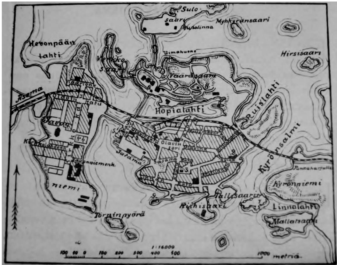
KUVA 1. Savonlinnan kaupungin asemapiirros vuodelta 1900 (Ailio 1905)

vietti kesiään. Putkinotko, oikealta nimeltään Inhan tila, sijaitsee Lehtiniemen kylässä, Savonlinnan keskustasta maanteitse 15 kilometriä pohjoiseen.