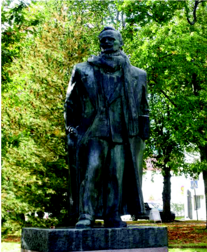
KUVA 2. Wäinö Aaltosen vuonna 1953 veistämä Joel Lehtosen patsas on yksi Savonlinnan merkittävistä kirjallisista käyntikohteista

kansalliskirjailijaksi. Kiertoajelulla kerrotaan kirjailijan lapsuudesta ja nuoruudesta sekä paluusta Savonlinnaan maineikkaana kirjailijana. Reitti kulkee Savonlinnan keskustasta kirjailijan lapsuudenkotiin Pihlajaniemen Vuohimäelle. Lehtosen elämäntyötä juhlustetaan vuosittain 13.7. Joelin päivänä, jolloin kokoonnutaan Joel Lehtosen patsaalle. Nimipäiväpuheiden ja patsaan kukituksen jälkeen tilaisuutta jatketaan Juuvelinpäiväkahveilla Putkinotkossa, Vuohimäessä tai Haukiniemessä, joka on Lehtosen syntymäpaikka. (Savonlinnan oppaat ry.)