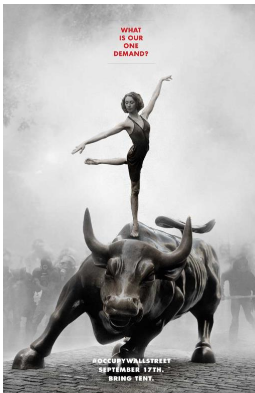
Kuva 3. Occupy Wall Street -protestiliikkeen koolle kutsunut juliste (Adbusters, 2011)

1900-luvun alun avantgarden sijaan artivismista on löydettävissä hyvin paljon situationistisen taiteen piirteitä. Esimerkiksi kulutuksenvastaisen Brandalism-taidekollektiivin teokset hyödyntävät täsmällisesti Guy Deborahin ja situationistien ajatusta ”detournementista”, jossa taiteilija kaappaa jo olemassa olevan asian, vääristää sen ja kääntää näin itseään vastaan. Tavoitteena on katkoksen tuottaminen, mikä saa taiteen kokijan kyseenalaistamaan arkipäivästä kokemustaan. Brandalistien toimintaan kuuluu esimerkiksi fossiiliyhtiöiden mainosten vaihtaminen kollektiivin muokkaamiin versioihin, joissa yhtiön toiminnan todelliset negatiiviset vaikutukset tuodaan ilmi. (Shank, 2004.)