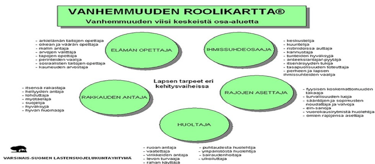
Kuvio 2. Vanhemmuuden roolikartta. (Vilen ym. 2010, s. 137).

epämukavaksi, kun taas ylikehittyneessä roolissa toiminta on liiallista eikä välttämättä kovin hyvin tilanteeseen soveltuvaa. Sopivasti kehittyneessä roolissa toiminta on luontevaa. Roolikartassa vanhemmuutta tarkastellaan viiden pääroolin kautta, jotka jakautuvat alarooleihin. Alaroolien kautta on helpompi muodostaa käsitys mitä päärooli voi tarkoittaa käytännössä. Vanhemmuuden roolikarttaa voi käyttää esimerkiksi keskustelun pohjana, itsearviointiin ja sanoittamisen apuvälineenä, havainnollistamaan vanhemmuuden eri näkökulmia ja muutostarvetta sekä perhetyöntekijä voi tuoda esiin näkökulmia vanhemmuuden arviointiin.