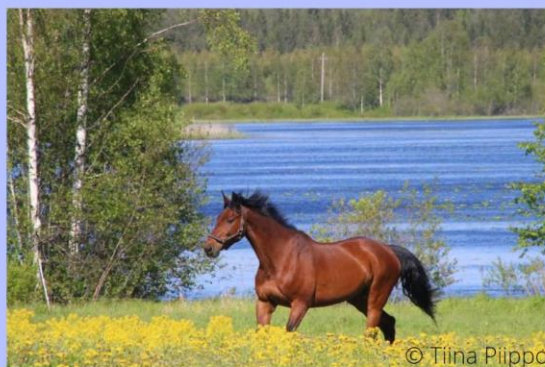
KUVIO 3. Työkirjan sisällysluettelo