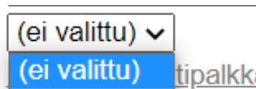
Kuva 2. Vanha dropdown