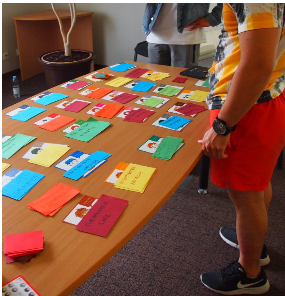
KUVA 1. Nuoria valitsemassa tunnekortteja (Koivula 2020)

Haastatteluiden menetelmällisenä apuvälineenä käytin tunnekortteja (kuva 1), joihin oli kirjoitettu erilaisia tunnesanoja. Tunnekorttien pohjana olivat Pesäpuu ry:n Tunne tyypit -kortit. Sanat oli käännetty osallistujien omalle äidinkielelle sekä englanniksi. Pyysin Viron ja Latvian nuorten ohjaajia avuksi kääntämään joitakin tunnesanoja kortteihin, jotka olivat haastavampia. Tunnekorttien tarkoituksena oli helpottaa osallistujien tunteiden tunnistamista ja niiden jäsentämistä. Pysin listamaan mahdollisimman monipuolisesti erilaisia tunteita positiivisista neutraalien kautta vaikeampiin ja negatiivisempiin. Tunnekortteja oli paljon, jotta jokainen sai haluamansa. Annoin myös mahdollisuuden kirjoittaa oman tunteen, jos osallistuja ei löytänyt mieluistaan valmiiden joukosta.