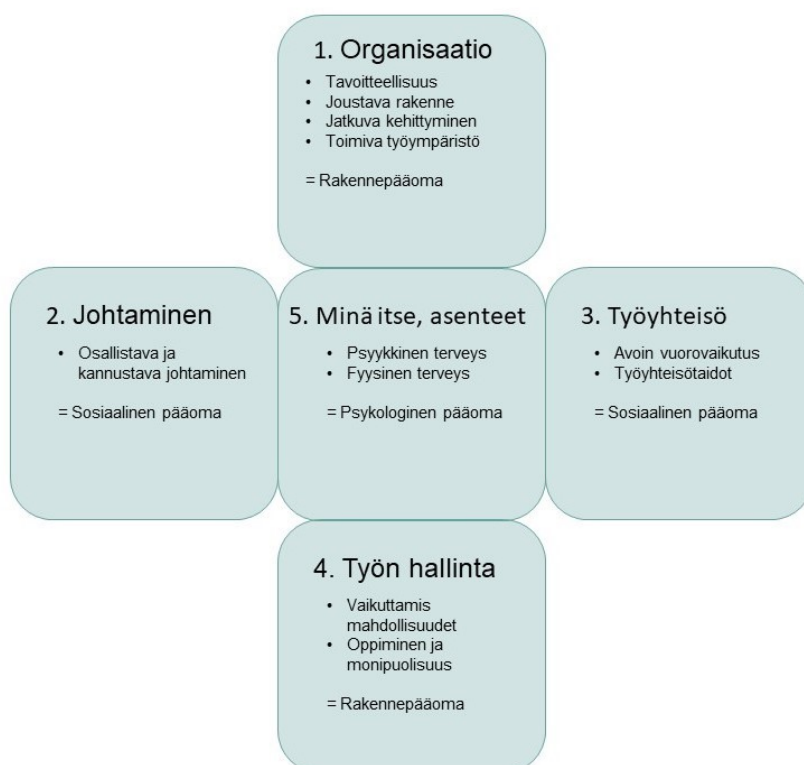
Kuva 2. Työhyvinvointiin vaikuttavat tekijät (Manka & Manka 2016, 76)

Marja-Liisa Manka ja Marjut Manka kuvaavat kirjassaan Työhyvinvointi voimavaralähtöistä työhyvinvointimallia, jossa työhyvinvointiin vaikuttavia tekijöitä lajitellaan pääomalajeihin. Näitä pääomalajeja on mallissa kolme: rakenteellinen, sosiaalinen ja psykologinen. Organisaation toimintatavat, kulttuuri ja työympäristö kuuluvat rakennepääomaan. Myös työn sisältö, ja se kuinka siihen voi vaikuttaa ovat osa rakennepääomaa. Sosiaalinen pääoma muodostuu johtamisesta, sen laadusta ja työilmapiiristä. Keskiössä tässä mallissa on yksilö ja yksilön asenteet sekä psykologinen pääoma, jonka muodostavat sekä psyykinen, että fyysinen terveys. Vaikka yksilön ympärillä olevat ulkoiset tekijät olisivat kohdillaan, yksilön oma hyvinvointi ja asenteet vaikuttavat merkittävästi työhyvinvoinnin kokemukseen.