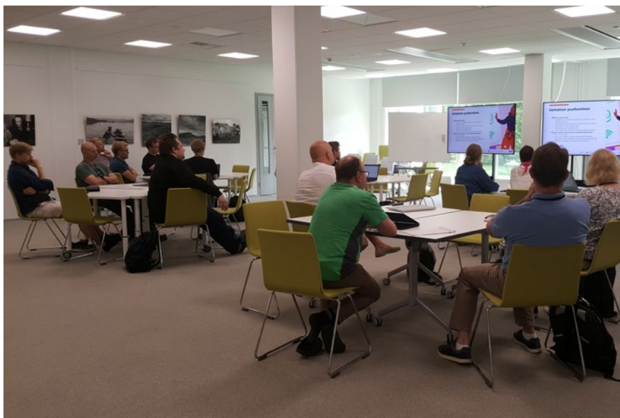
Study Group -tuutorointikoulutus opettajatuutoreille.

Kun opettajatuutori ohjaa Study Group -ryhmiä, tuo se tehokkuutta hänen työhönsä varsinkin, kun aloittavassa ryhmässä on useita kymmeniä opiskelijointa. Opettajatuutori tapaa Study Group -ryhmät muutaman kerran lukukauden aikana. Tapaamisten aikana opettajatuutori tiedottaa ajankohtaisista asioista, ohjaa, neuvoo ja tsemppaa. Tarvittaessa opettaja voi jakaa tapaamisten aikana samaansa tietoa eteenpäin organisaatiossa toiminnan kehittämiseksi. Mikäli opiskelija haluaa henkilökohtaisen oh-