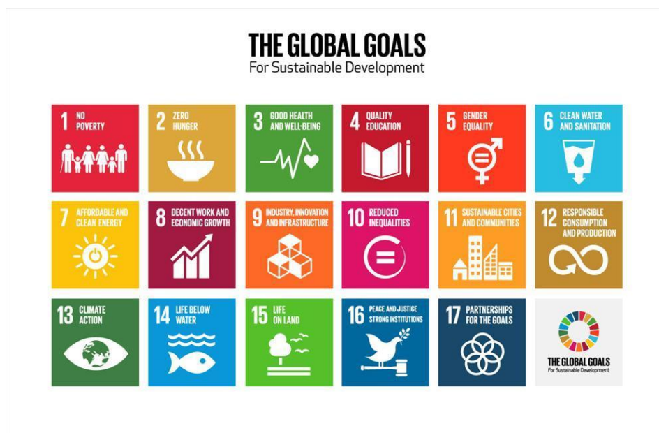
Figur 2. The 2030 Agenda for sustainable development. (Europeiska kommissionen, 2022).

Alla länder har själva ansvar för det egna landets utveckling. Utrikesministeriet i Finland skriver att Finland åtar utmaningen både nationellt och internationellt. Som ett av föregångarländerna vill Finland ligga i framkant. Finlands regering lämnar med fyra års mellanrum in redogörelse till riksdagen, i dagens läge har den senaste lämnats in till riksdagen oktober 2020. Redogörelsen innehåller de åtgärder som vidtagits, punkt för punkt, både inom landets gränser och utanför. Efter de vidtagna åtgärderna beskrivs metoderna och den utvärdering som gjorts (i jämförelse till målen). Den här redogörelsen skickas även till FN. Som ett av länderna i framkant bör, så var Finland ett av de första länderna som uppgjorde Agenda 2030 plan frivilligt. Nedan finns en bild på Europeiska kommissionens 17 olika huvudmål för hållbar utveckling. Under de här 17 målen finns 169 delmål som ska uppnås år 2030. (Statsrådet, 2020)