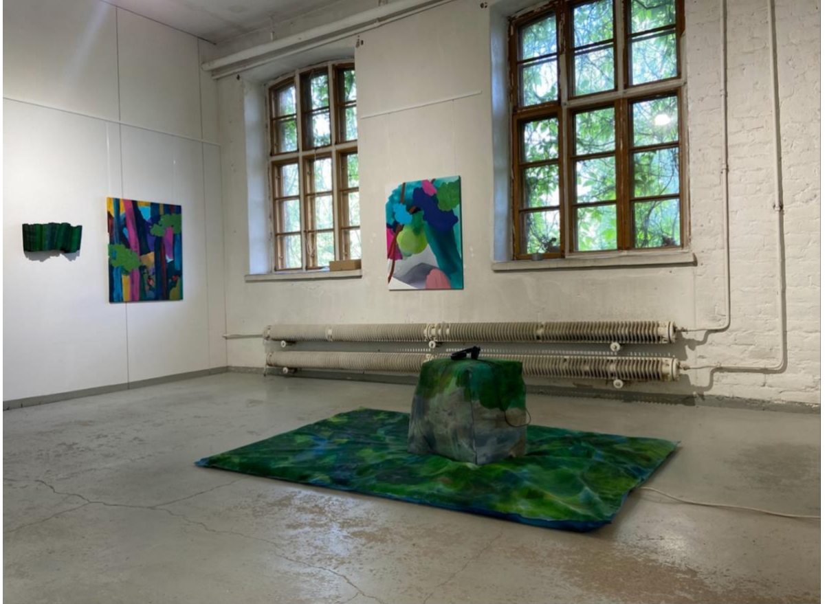
Kuva 1. Laura Laurila: The Forest Within, Walleniuksen Wapriikki.