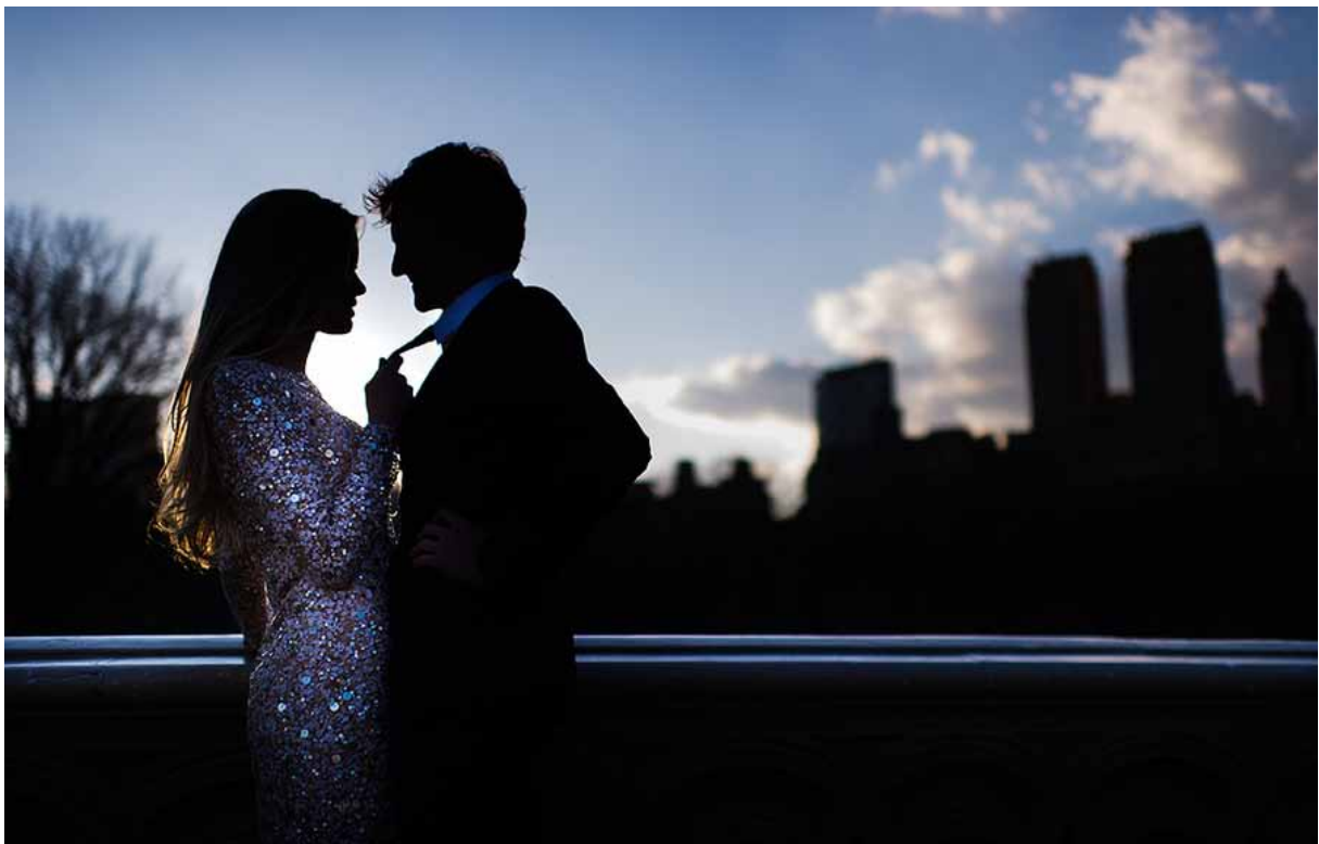
^ Hääkuva vuodelta 2010

Kuvatessani häitä häparin toimeksiannosta lähetän heille vain kuvat, joissa läheisyys on ilmeisintä. Yleensä paria kuvatessa ei läheisyys tuota ongelmia.