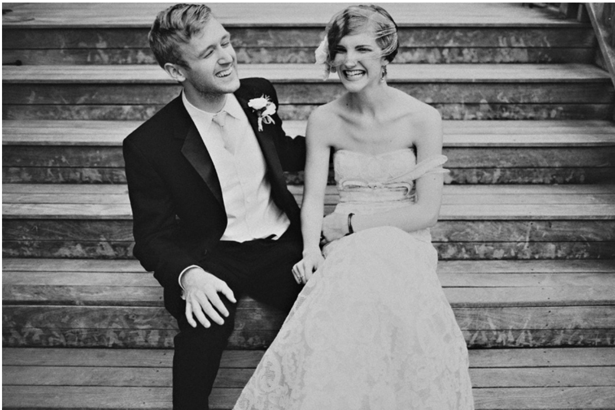
^ Hääkuva vuodelta 2012

oppi ennustamaan kolmen minuutin videopätkän perusteella, ketkä erosivat ja mitkä parit pysyivät yhdessä. Olennaisin merkki liiton ongelmista oli halveksunta: jos toinen tai molemmat osoittivat halveksuntaa puolisoaan kohtaan, eron todennäköisyys kasvoi. Muita huonoja merkkejä olivat kriittisyys, puolustuskannalla olo ja vetäytyminen. Onnelliset parit käyttäytyivät kuin hyvät ystävät ja selvittivät erimielisyydet ilman avoimia vihan tai halveksunnan osoituksia. Työryhmän avioeroennuste osui 94-prosenttisesti oikeaan.