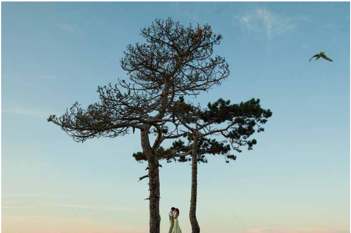
^ Hääkuva vuodelta 2011