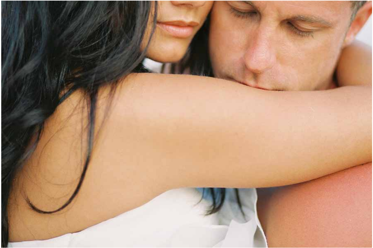
^ Hääkuva vuodelta 2012