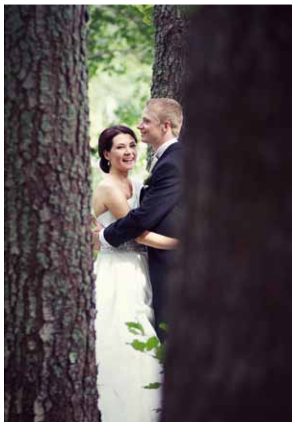
^ Kuvaaja: Jasmin Rauha

Kuvatessa kehotin pareja asettumaan melko samanlaisiin asentoihin kuin hääkuville, jotka minulla oli mielessäni. Yritin löytää kotoa ympäristön jossa se olisi luonnollista, mutta onnistuisi myös teknisesti. Kerroin pareilleni ku-