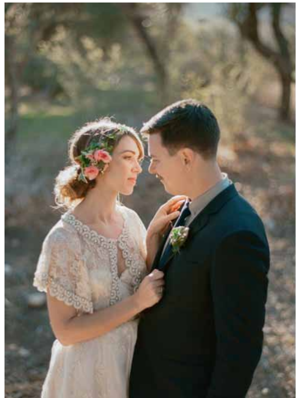
^ Hääkuva vuodelta 2013

Jos parista otetaan lämpimät hääku-vat, tarkoittaako se välttämättä, että he ovat onnellisia, vai tarkoittaako se vain, että he osaavat esittää läheisyyt-tä? Voiko sen tietää?