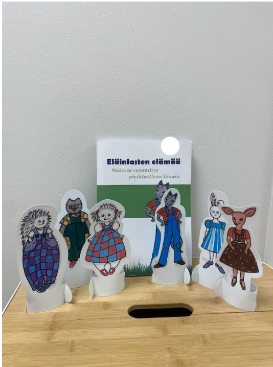
Kuvio 2: Kaveritaitoteatteri materiaali

Jokaisen toimintakerran jälkeen lapset pääsevät kertomaan kokemuksistaan. Jokaisen mielipide otetaan huomioon ja he saavat kertoa vapaasti, miten toiminta on mennyt ja kuinka tiimityö on sujunut. Kolmannella toimintakerralla lapset pääsevät olemaan osa tarinaa. Toiminnallinen opinnäytetyö antaa lapsille mahdollisuuden oppia ja kehittyä samalla, kun aikuinen näkee, millaista toiminta päiväkodissa on. Toimintakerrat antavat mahdollisuuden seurata lasten nykyisiä taitoja tiimityö ja kaveritaitojen merkeissä. Lapset oppivat toiminnan kautta ja tässä ikäryhmä huomioiden tämä oli lapsille luonnollinen tapa tehdä toimintaa ja näyttää näin mahdollisimman realistisen kuvan nykyisestä tilanteesta.