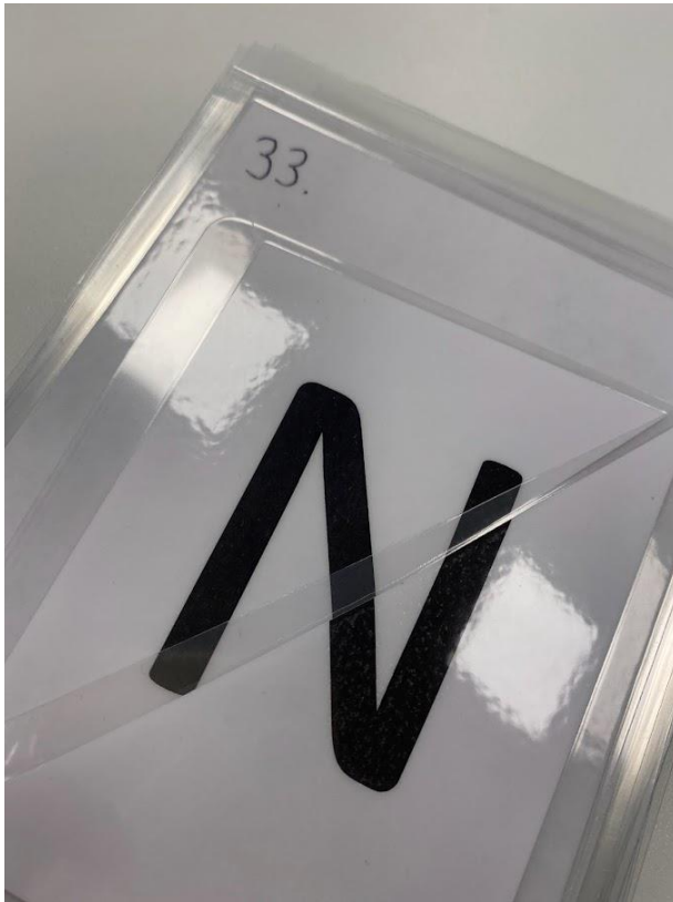
Kuvio 1: Esimerkki kirjain

Kolmantena toimintakertana on kaveritaitoteatteri. Ryhmät ovat samat kuin ensimmäisessä toiminta kerrassa eli noin seitsemän lasta. Kyseessä on valmiita tarinoita liittyen mielenterveyteen sekä kaveritaitoihin. Koska kyse on pöytäteatterista, on mukana tarinoihin liittyviä hahmoja. Lapset pääsevät itse toimimaan teatterin esittäjinä ja pääsevät näin olemaan osallisia heti tarinan alusta. Tarinat ovat lyhyitä pätkiä, joissa keskellä tarinaa pysähdytään ja esille nostetaan ongelma tarinasta. Ongelma liittyy kaveritaitoihin ja kysymys voi kuulua esimerkiksi ”toimittiinko tässä tilanteessa oikein”. Lapset pääsevät miettimään tapahtunutta ja kertomaan miten heidän mielestään hyvä kaveri toimisi tilanteessa. Tarinoissa on kirjattuna apukysymyksiä, jotka mahdollistavat jokaiselle lapselle sellaisen kysymyksen, mihin pystyy vastata, esimerkkinä ”onko perhe tärkeä”. Jokainen lapsi pääsee toimimaan esittäjänä vähintään kerran ja aikuinen lukee tarinaa. mikäli aikaa toiminnan suorittamisen jälkeen jää käydään lasten kanssa vielä erilaisia tilanteita läpi, missä he ovat mielestään olleet hyviä kavereita toiselle.