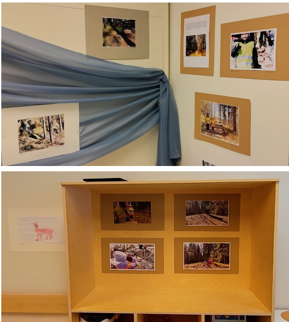
KUVA 10. Näyttelyn tila eri kulmista

Se toi selkeän järjestyksen, ja katsojan oli mielestäni näin mielekkäämpi seurata kuvia. Näyttelymateriaalin asettamisvaiheessa myös lapset olivat mukana ja saivat toivoa, kenen kaverin töiden viereen haluavat kuviansa (kuva 11). Näyttelyn ovelle laitoin lämminhenkisellä kuvalla varustetun tervehdyksen ja näyttelyn nimen. Näyttelylle annoin nimeksi projektimme mukaisesti ”Voimauttava valokuvaus”. Huoneessa soi rauhallinen klassinen musiikki, johon oli upotettu metsän ääniä kuten linnunlaulua. Tämä herätteli kuvia eloon ja lisäsi tunnelmaa, jonka toivoin koskettavan jokaista kävijää jollain tavalla.