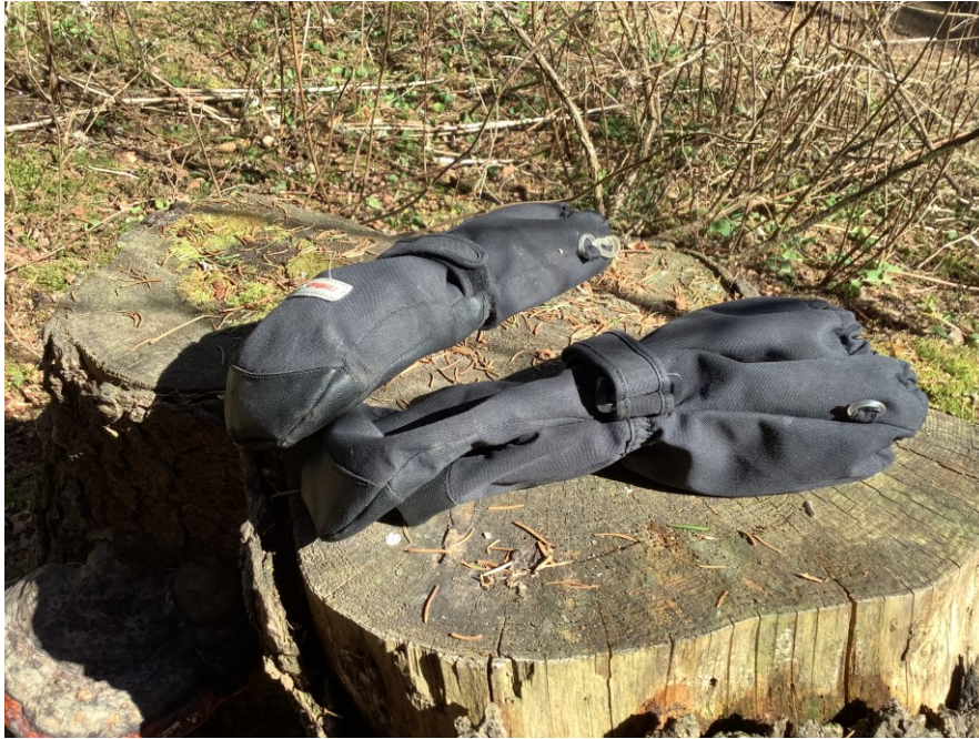
KUVA 6. Kevään havaintojen valokuvaaminen metsäretkellä: lämpimänä päivänä ei tarvita rukkasia.

Nykylapset ovat tottuneita olemaan valokuvattavina, ja yleensä he ovat luonnollisesti, kun toiset kuvaavat heitä. Nyt tässä projektissa he harjoittelivat olla pääroolissa ja päättivät itse kuvakulmista sekä itse miettivät, miten haluavat esiintyä valokuvissaan (kuva 7). Tämä vaati kuvaajalta myös maltillisuutta ja keskittymiskykyä. Tätä harjoittelimme myös valokuvausprojektin aikana. Ohjeiden noudattaminen monipuolisten sekä kiinnostavien tehtävien yhteydessä ja niissä pysyminen oli hyvä pohja tähän tavoitteeseen.