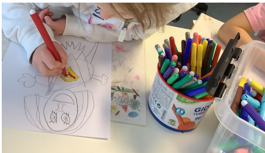
KUVA 1. Sankarihahmon piirtäminen

Toimintaa lähdettiin pohjustamaan lasten kanssa keskustellen eri vaihtoehtoja kuvata itseä ja muita: piirtäen, maalaten vai valokuvaten. Sillä valokuvauksen ohella olisi mahdollista hyödyntää muitakin tapoja (kuva 1).