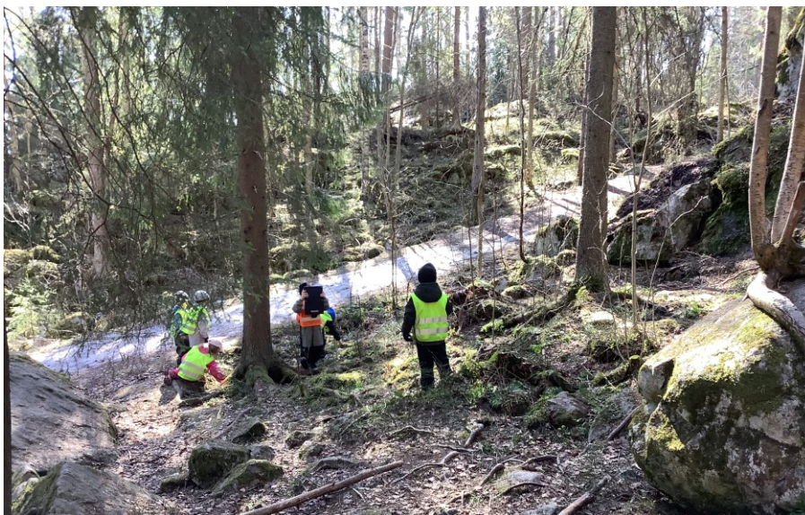
KUVA 7. Kuvattavan toiveiden huomioiminen kuvaushetkellä

Nykylapset ovat tottuneita olemaan valokuvattavina, ja yleensä he ovat luonnollisesti, kun toiset kuvaavat heitä. Nyt tässä projektissa he harjoittelivat olla pääroolissa ja päättivät itse kuvakulmista sekä itse miettivät, miten haluavat esiintyä valokuvissaan (kuva 7). Tämä vaati kuvaajalta myös maltillisuutta ja keskittymiskykyä. Tätä harjoittelimme myös valokuvausprojektin aikana. Ohjeiden noudattaminen monipuolisten sekä kiinnostavien tehtävien yhteydessä ja niissä pysyminen oli hyvä pohja tähän tavoitteeseen.