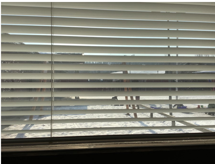
KUVA 2. Raidallisen ympäristön havainnointia valokuvaamisen avulla

lasten tulisi toimia. Tässä tärkeä osuus oli lasten vireystila, koska he toimivat pareina. Siksi heidän oli tärkeä kuunnella ohjeita ja toimia niiden mukaisesti. Ohjeet olivat joko suullisia tai kuvan avulla hahmotettavia ohjeita, esimerkiksi löytää raidallisia kohteita päiväkodin sisätiloista (kuva 2). Tällöin lapset saivat kulkea pareina kaikkialla vapaasti, sillä pajat tapahtuivat muiden ryhmien ulkoilu-aikoina ja muiden työskentely ei silloin häiriintynyt tämän vuoksi.