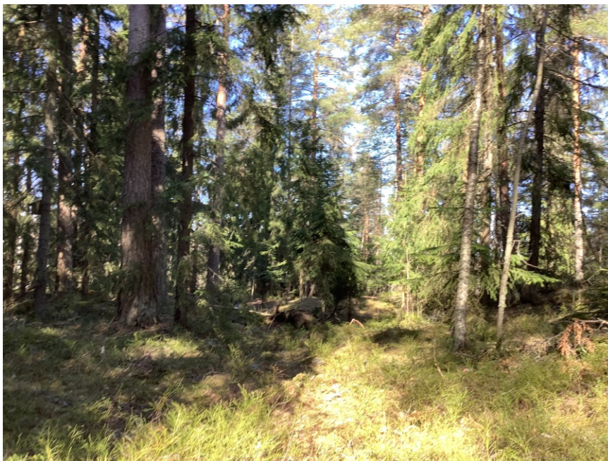
KUVA 5. Keväistä toimintaympäristöä päiväkodin lähimetsässä

Pajoissa joka kerta keskustelimme myös lopullisesta työstä, joka oli meidän pää-tavoitteenamme. Eli kaikkien sankarihahmojen kuvaamisista tultaisiin koostamaan yhteinen näyttely. Näin asiasta tuli tavallinen, joten heidän ei tarvinnut sitä jännittää. Kun jokainen oli päättänyt hahmostaan alkuistunnoissa, he saivat piirtää mielikuvansa paperille parillensa hahmotettavaksi. Kun työ oli valmis, he saivat kertoa, mitä heidän sankarihahmonsa osaa ja missä hän siinä piirustuksessa on. Nämä piirustukset olivat vain suunnitteluvaiheen alkua, ja hahmo sai muuttua ja kehittyä koko matkan ajan.