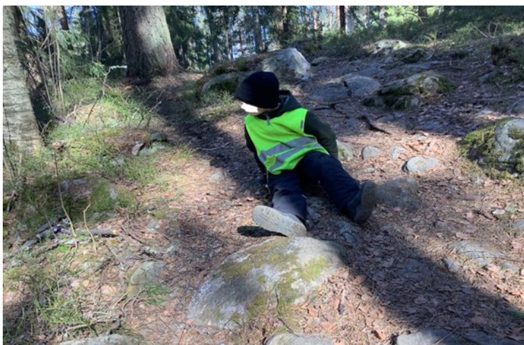
KUVA 9. Lapsi katselemassa näkymätöntä metsähiirtä

Seuraavassa vaiheessa otin yhden parin kerrallaan työskentelemään, jotta lapsilla olisi työrauha ja itsellä helpompi ohjata sekä havainnoida heitä. Ohjeistin joka paria, miten he voivat keskenään pohtia kuvauspaikkaa sekä lempihahmojaan ja vielä sitäkin, mistä näkökulmasta toinen valokuvaa parinsa kuitenkin valokuvattavan toiveiden mukaisesti (Kuva 9). Kuvia saisi olla useita, jotta olisi valinnanvaraa. Seuraavilla kerroilla tulisimme palaamaan saatuihin tuotoksiin koko ryhmän kanssa ja niitä tarkastellen kuvassa olevan henkilön ilmeitä ihailen.