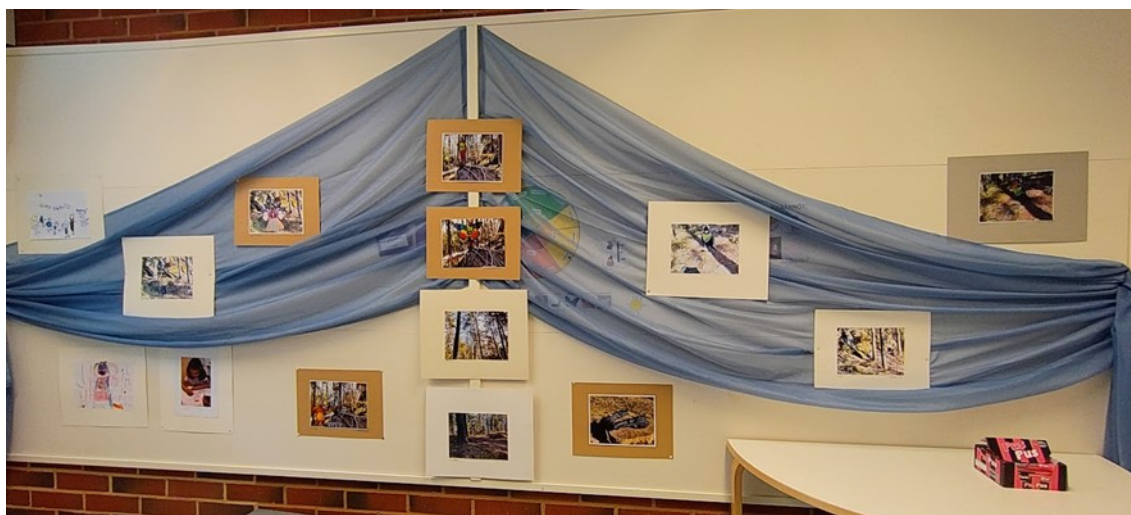
KUVA 12. Kuvaus osasta näyttelyn aineistoa

Tämä näyttely koostui vain kuuden tutkimuksessani mukana olleen lapsen kuvista, ja rajallisen ajan vuoksi koko ryhmän valokuvanäyttely ei tällä kertaa toteutunut (kuva 12). Olen perustellut tämän aiemmin tekstissäni.