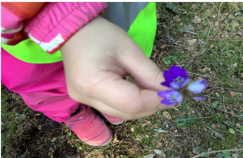
KUVA 4. Keväthavaintoja valokuvauspäivänä

Pajatoiminnan aikana oli ideana aktivoida lasten osallisuutta ja toteuttaa se heiltä lähteneistä toiveista. Pajan alkaessa oli siis merkityksellistä pitää yhteinen hetki ja pysähtyä asioiden äärelle. Siinä vaihdettiin kuulumisia ja samalla lapset saivat esittää toivomuksensa päivälle. Myös itse ohjaajana olin osa porukkaa, ja osallistuin samalla tavalla keskusteluihin.