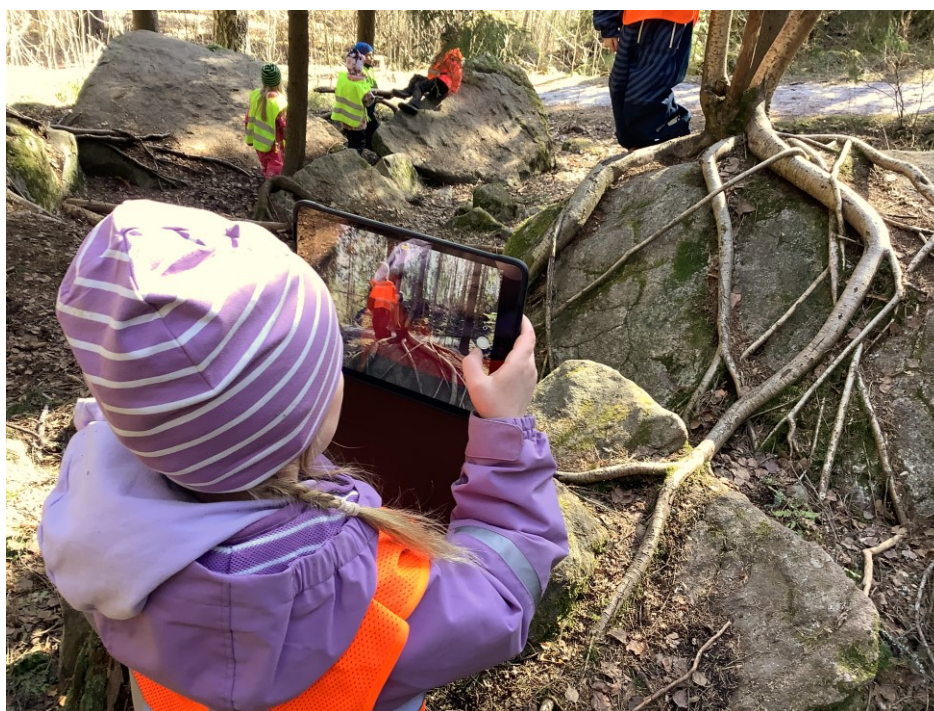
KUVA 8. Valokuvaamista metsäluonnossa

Itse sankarihahmon valokuvaustilanne tapahtui hyvin sujuvasti metsässä, sillä lapset ovat vapautuneempia siellä ja monet asiat onnistuvat kokemuksen mukaan luonnossa paremmin (kuva 8). Sillä lapset tuntuvat keskittyvän tehtäviinsä siellä paremmin, koska siellä voi liikkua vapaammin eikä äänenkäyttöä tarvitse rajoittaa niin paljon kuin sisätiloissa. Lisäksi metsäluonnon käyttö oppimisympäristönä edesauttaisi VASUN osa-alueen Tutkin ja toimin ympäristössäni tavoitteiden toteuttamisessa (Varhaiskasvatussuunnitelman perusteet 2018, 46.)