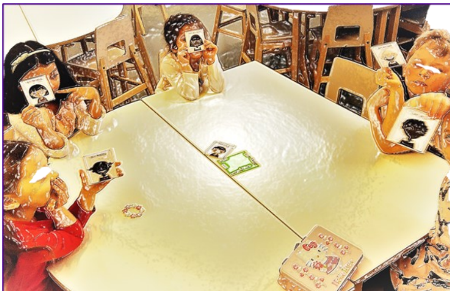
KUVA 3. Yksilöllisen tunnetilan huomioiminen ryhmän jäsenenä

Koska osa lapsista tarvitsi enemmän ohjeistusta ja aikuisen läsnäoloa, toiset parit saivat työskennellä keskenään annettujen ohjeiden mukaisesti ja saivat käyttää myös omaa luovuuttaan. Silloin sain olla tukea tarvitsevien parissa paremmin.