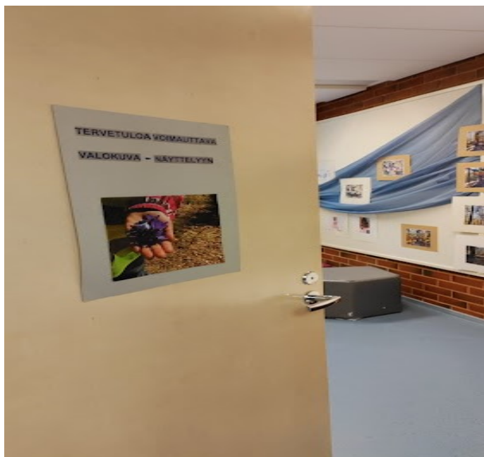
KUVA 11. Näkymä astuttaessa sisään valokuvanäyttelyyn

Tämä näyttely koostui vain kuuden tutkimuksessani mukana olleen lapsen kuvista, ja rajallisen ajan vuoksi koko ryhmän valokuvanäyttely ei tällä kertaa toteutunut (kuva 12). Olen perustellut tämän aiemmin tekstissäni.