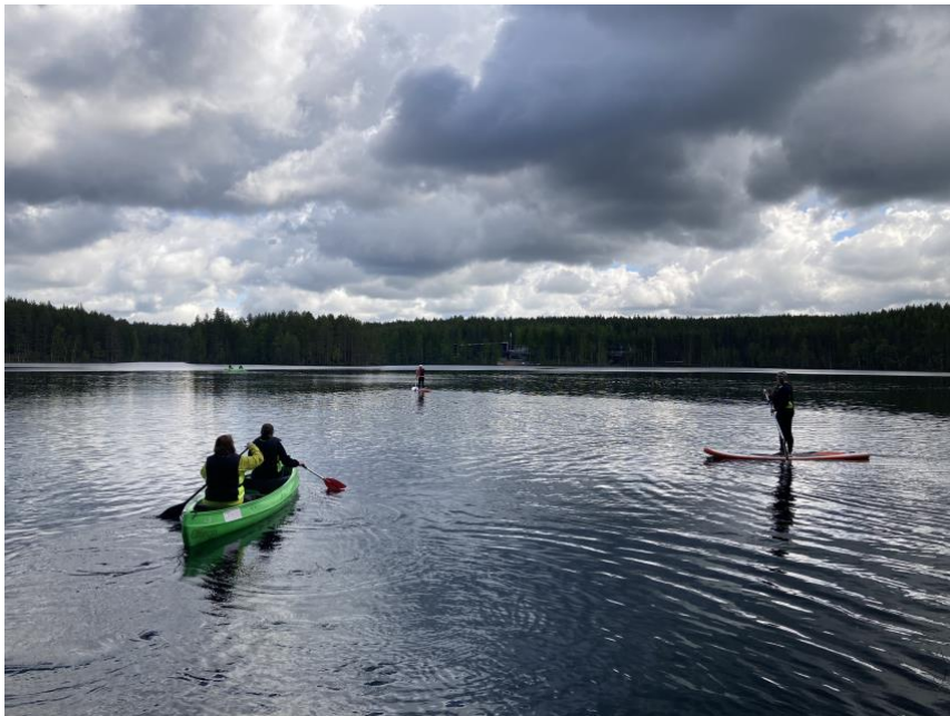
KUVIO 4. Asiakkaat kokeilemassa melontaa ja SUP-lautoja yhdessä ohjaajien ja vartijan kanssa

Luontoretki vei vangit hetkeksi pois vankilaympäristöstä tarjoten heille rauhallisen luontokokemuksen. Toiminnot olivat sellaisia, että kaikki pääsivät osallistumaan ja kokemaan jotain uutta, kuten ruuan valmistusta nuotiolla, retkeilyä, SUP-lautailua sekä melontaa. Toimintapäivän aikana huolehdittiin myös itsestä liikkuen ja ruokaillen.