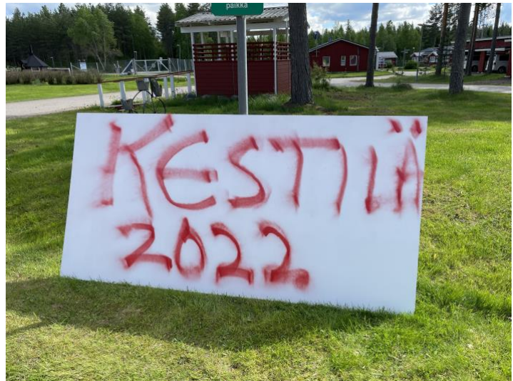
KUVIO 6. Yhteisöllisen taideteoksen toimintapiste ja lopputulos