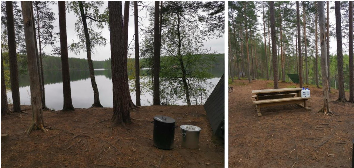
KUVIO 3. Rokuan leirialue ennen toiminnallisen viikonlopun alkua.

Projektilla oli alusta asti aktiivinen yhteistyö Kestilän vankien ja henkilökunnan kanssa. Vierailujen yhteydessä toiminnallisen viikonlopun ohjaajat esittäytyivät ja toivat toimintaterapian ammattia ja -osaamista esille. Toiminnallisesta viikonlopusta ja ohjaajista lähetettiin ennakoon esittelyjulisteet, jossa kerrottiin toiminnallisen viikonlopun ideasta ja pyydettiin vankeja osallistumaan toimintojen suunnitteluun. Suunnittelupalavereissa vangeilta tuli paljon ideoita ja yhdessä keskustellen saatiin kerättyä toimintoja, jotka oli mahdollista toteuttaa. Vankilavierailun jälkeen aloitettiin toiminnallisen viikonlopun toimintojen suunnittelu vankien toiveiden mukaisesti. Osa toiveista pystyttiin toteuttamaan, mutta osa jäi pois järjestäjistä riippumattomista syistä. Näiden toimintojen tilalle projektiryhmä mietti uusia toimintoja, jotka saivat hyväksynnän vangeilta.