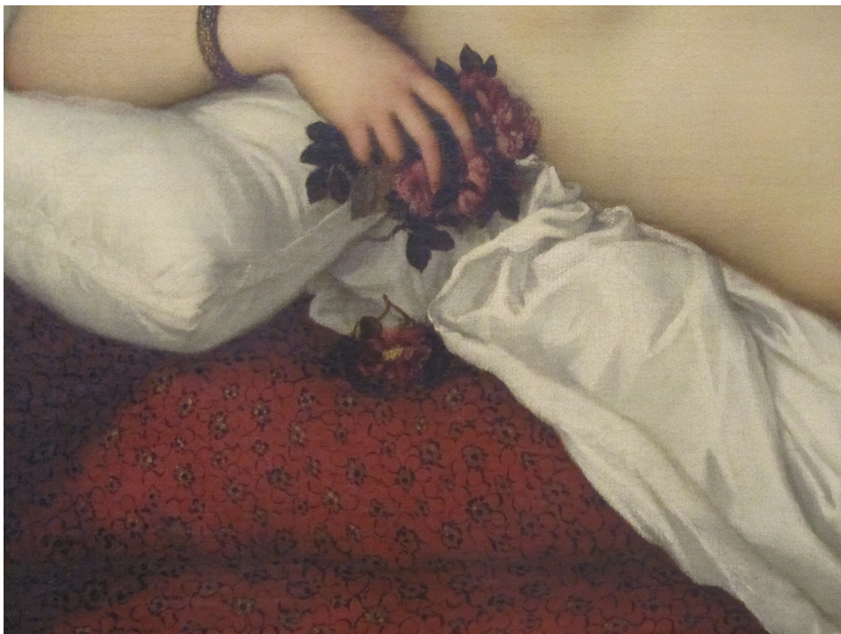
Kuva 5. Yksityiskohta: Tiziano Vecellio, Venus / Venus of Umbrino (öljy kankaalle, 119 X 165 cm, 1538, Galleria Uffizi, Firenze).

(Sirkus Finlandia 2021, Helsinki & Glamazonatrix 2022, Dublin.)