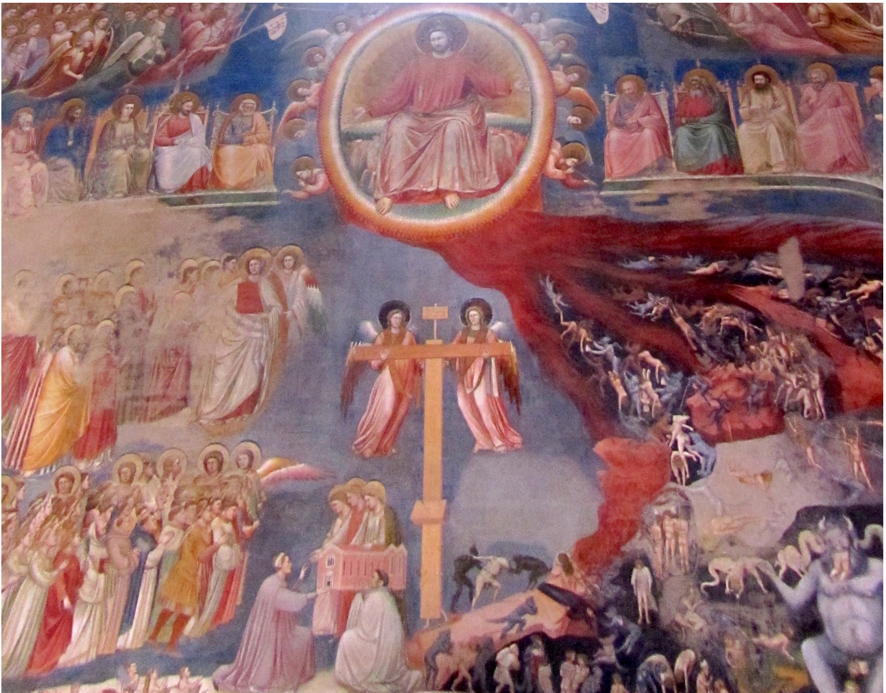
Kuva 2. Yksityiskohta Giotton maalauksesta, Cappella degli Scrovegni, Padova, 1304-06.

Luonto-teema on taidehistoriallinen perinne. Luodessaan oman version perinteisestä aiheesta, tekijä liittyy teemalliseen ja ajalliseen punokseen.