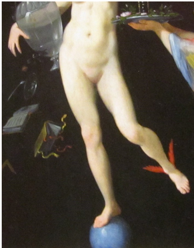
Kuva 1. Yksityiskohta Jacobo Ligozzin (s. 1547 – k. 1627) teoksesta Kohtalon allegoria (Allegory of Fortune), öljy puulle, 44 x 26,5 cm, 1500-luvun loppupuoli, Galleria Uffizi, Firenze.

selityksille, jotka muodostavat oman mytologiansa maalauksessa Vuodenajat. Katsojalla on yleisesti vastuu aktiivisena toimijana ja muutoksen tekijänä kulloisenkin merkin selitystä koskevan lähteen valinnassa.