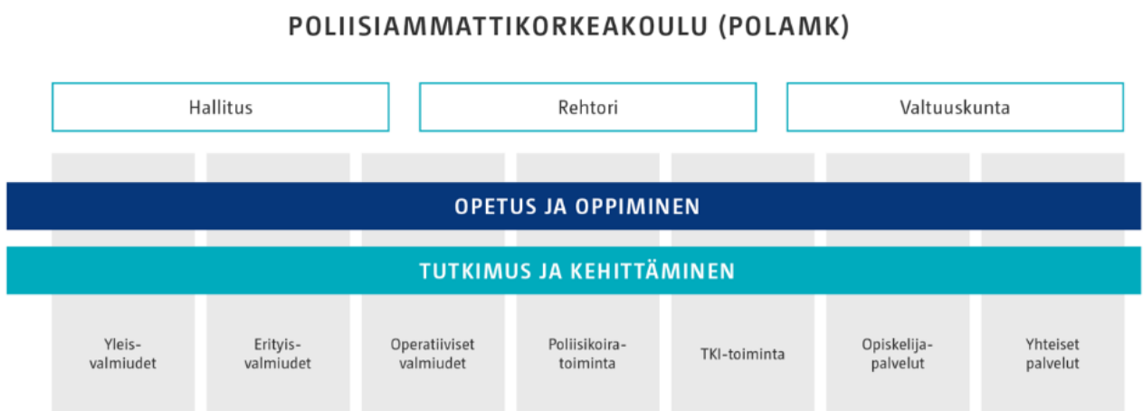
Kuvio 2. Poliisiammattikorkeakoulun organisaatio.

Poliisiammattikorkeakoulu kertoo verkkosivuillaan olevan myös sitoutunut noudattamaan hyvää tieteellistä käytäntöä. Tutkimusta tehdään eettisesti kestävästi sekä tutkimuseettisen neuvottelukunnan ohjeiden ja periaatteiden mukaan. Toimintaa kehitetään avoimen tieteen ja tutkimuksen periaatteiden mukaisesti.