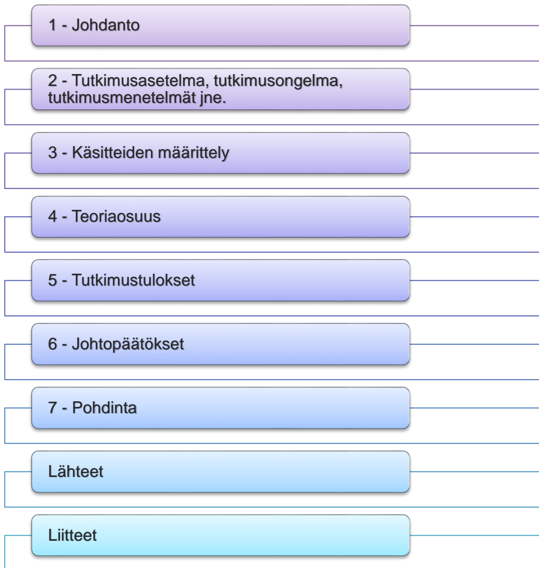
Kuvio 4. Opinnäytetyön rakenne (mukailtu Kananen 2015, 21.)

Standardisoidun rakenteen tarkoituksena on tehdä selväksi lukijalle se, miten hän löytää työstä ne kohdat, joiden perusteella tieteellisiä julkaisuja yleensä arvioidaan. Rakenteen tavoitteena on myös varmistaa, että työstä löytyy tieteelliselle raportoinnille olennaiset osat pakottamalla kirjoittajan tarkastelemaan niitä tekijöitä, joilla saavutetaan tutkimustulosten luotettavuus. (Kananen 2015, 25.)