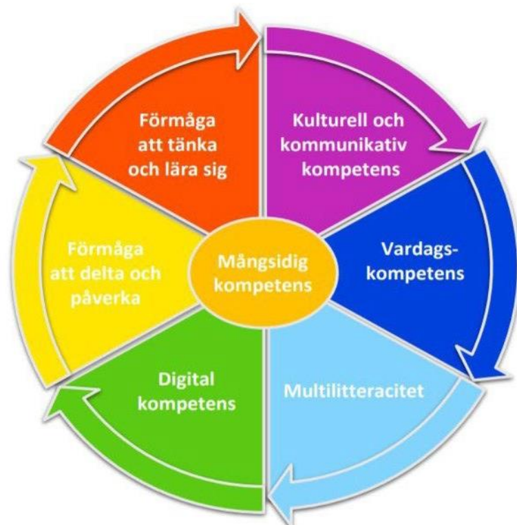
Figur 1. Mångsidig kompetens inom småbarnspedagogiken (Utbildningsstyrelsen)

Inom småbarnspedagogiken bildas grunden för barnets mångsidiga kompetens, en helhet som består av kunskap, färdighet, värderingar och vilja. Mångsidiga kompetensen utvecklas under hela människans livstid och påverkas av personliga värderingar, attityder och viljan att inverka hur barnet tillämpar sin kunskap och färdighet. En kvalitativ pedagogisk verksamhet stöder den mångsidiga kompetens som bidrar till att barnen formas till individer och medlemmar i grupp samt kunskap och färdigheter för livet. I grunderna för planen för småbarnspedagogik beskrivs mångsidig kompetens i sex delområden.