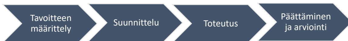
Kuvio 1. Lineaarisen mallin mukaan etenevä opinnäytetyö (Salonen 2013, 15)

yhtäaikaisia, mutta lineaarinen malli edustaa järkipäätä logiikkaa. Sen mukaan lopputulokset ja etenemisjärjestys ovat kuitenkin mahdollisimman tarkasti ennakoitavissa ja toteutukseen liittyvät epävarmuustekijät hallittavia ja ennakoitavia. (Salonen 2013, 15; Salonen ym. 2017, 52.)