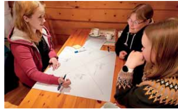
Rovaniemen työpaja 15.9.2021.

Päivähoidon kehittyminen sai kiitosta, samoin kuin yleinen sukupuoliroolien väljentyminen koko yhteiskunnassa. Nykyään isätkin hoitavat huushollia ja lapsia. Iloisen puheensorinan joukosta kantautui ajatus siitä, että nainen voi olla itsenäisesti poromies riippumatta siitä, onko mies poromies vai ei. Muistutettiin sanonnas-