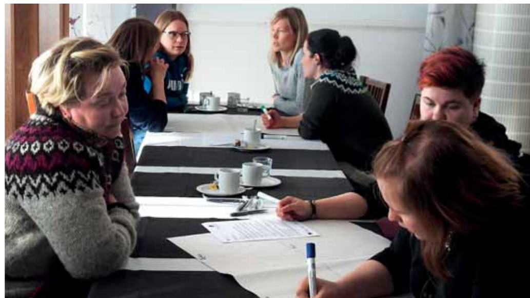
Inarin työpaja 3.5.2022.