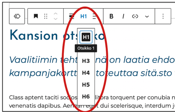
Kuva 6. Otsikkotyylin määrittely HTML-elementeillä verkkosivuilla.