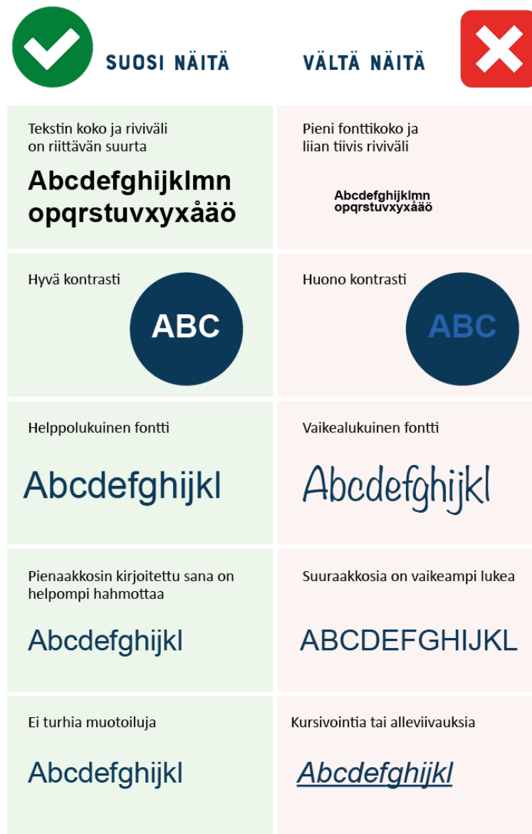
Kuva 3. Esimerkkejä hyvästä sekä huonosta typografiasta.

Vaikka sähköisellä näytöllä olevia kirjasintyyppettä on paranneltu siitä saakka, kun niitä on alettu lukemaan näytöiltä (Itkonen 2005, 117)., sähköisessä julkaisussa ei päästä typografian osalta yhtä laadukkaaseen lopputulokseen kuin painetuissa julkaisuissa (Korpela 2010, 19). Kannattaa kuitenkin tehdä se, mitä on tehtävissä.