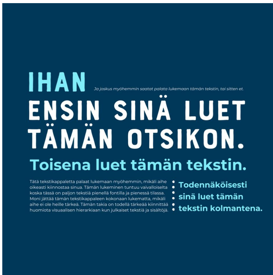
Kuva 5. Esimerkki visuaalisen hierarkian merkityksestä typografiassa.

Visuaalisella hierarkialla pystytään viestimään siitä, mikä osa tekstiä tai sivua on tärkein. Esimerkiksi otsikot tulee erottaa muusta tekstistä visuaalisella hierarkialla. Pelkkä tekstin muotoilu ei riitä vaan tulee käyttää otsikkotyylejä. Oikeanlaisella otsikolla on suuri merkitys tekstin ja sisällön hahmottamiselle. Otsikko kiinnittää lukijan huomion, jolloin se luetaan ensin ja vasta sen jälkeen siirrytään varsinaisen tekstin lukemiseen. (Selovuo 2019, 47.) Väliotsikkoja on hyvä käyttää runsaasti (Parkkinen 2002, 91).